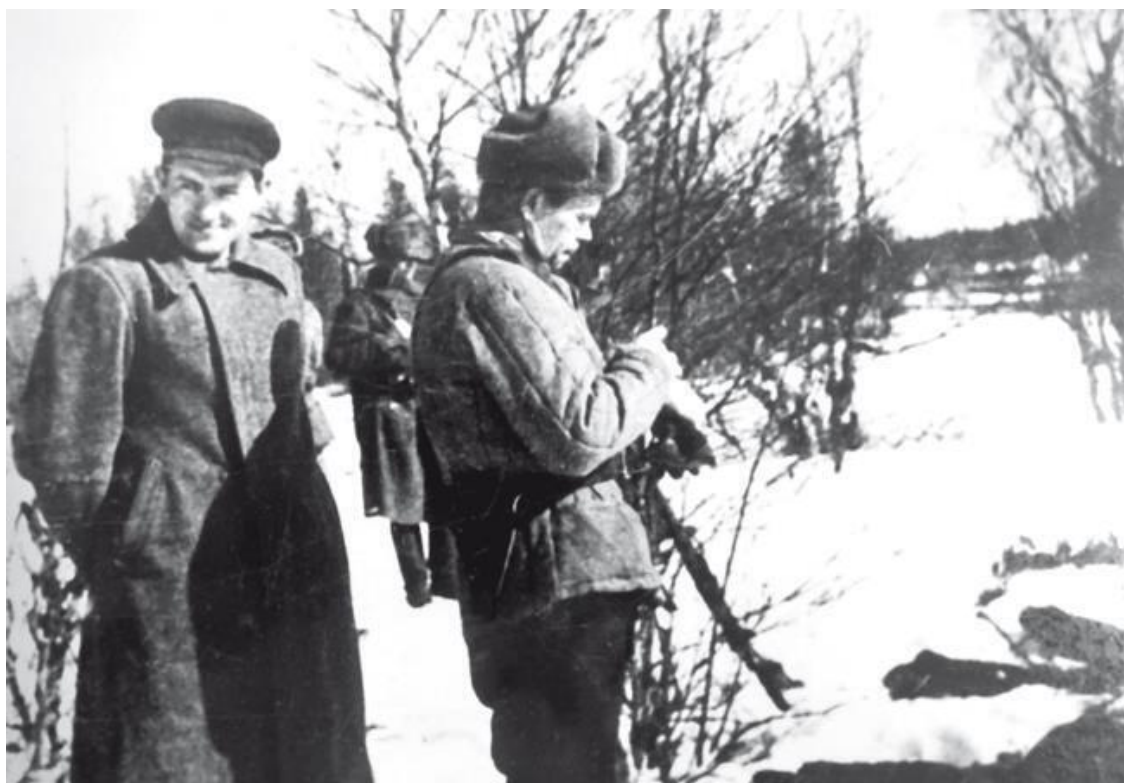
Ю.В. Андропов (слева) на боевых стрельбах в Спецшколе ЦК КП(б). КФССР. 1943 год

При отходе частей Красной Армии в пос. Соломенное были оставлены 5 комсомольцев. При помощи радики и ходок с этими товарищами установлена связь и даются задания по созданию комсомольских организаций. Ряд комсомольцев удачно осели в районах и устроились на работу в финских государственных учреждениях, а в Шелтозерском районе комсомолка работает в финском штабе машинисткой. Через этих комсомольцев также ведется разведка неприятельского тыла. Для ведения работы в комсомольском подполье ЦК ЛКСМ имеет три радики, из которых одна уже доставлена и работает в Петрозаводске...».