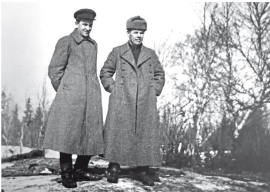
Ю.В. Андропов и зав. организационным отделом ЦК КП (б) КФССР И.В. Власов. 1943 год

В отчете «О работе комсомольских организаций в тылу противника среди населения захваченной территории КФССР» от 15 января 1942 г., направленном в ЦК ВКП(б) сообщалось, что с начала войны на нелегальную работу в органы разведки и для руководства подпольными организациями направлены 403 комсомолец. Комсомольские группы, с которыми установлена связь, действуют в 4 районах республики, при этом в Петрозаводск было направлено 8 комсомольцев. Всего же в годы оккупации в Петрозаводске действовали две партийно-комсомольские ячейки, насчитывавшие 26 членов.