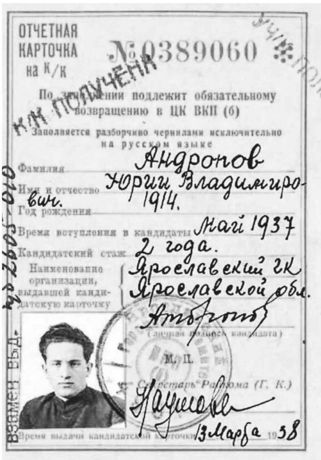
Отчётная карточка кандидата в члены ВКП (б) Ю. Андропова. Март 1938 года

них доморощенных «антикоммунистов», отнюдь не отрицал наличия у коммунистической идеи «плодотворных и даже конструктивных аспектов стремления к совершенному обществу», и даже выражал надежду, что уже в XX веке «современные плюралистические демократии сделают их частью своих систем» 7 .