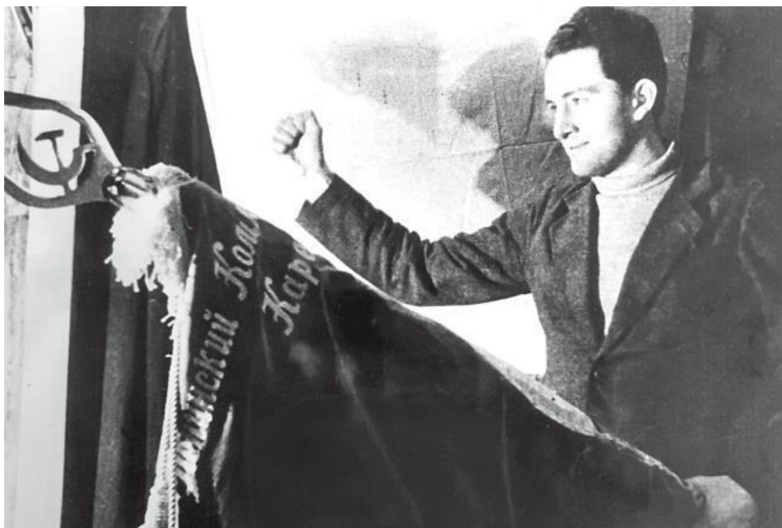
Ю.В. Андропов на вручении переходящего Красного знамени ЦК комсомола Карелии 73-му Краснознаменному отряду 101-го пограничного полка