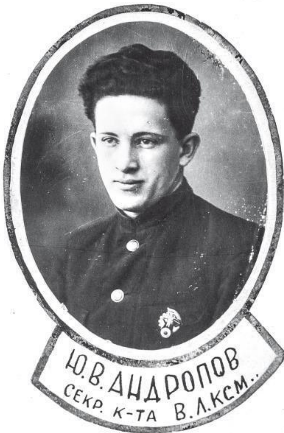
Секретарь комитета ВЛКСМ Рыбинского речного техникума

Однажды, во время судоходной практике, курсант Андропов упал в холодную октябрьскую воду, был спасен товарищами, долго болел, а как следствие – получил осложнение на почки, что стало его хроническим заболеванием, приведшим, в конце концов, к летальному исходу. Именно по причине этого заболевания в 1936 г. Ю.В. Андропов был освобожден от призыва в РККА и признан негодным к строевой службе.