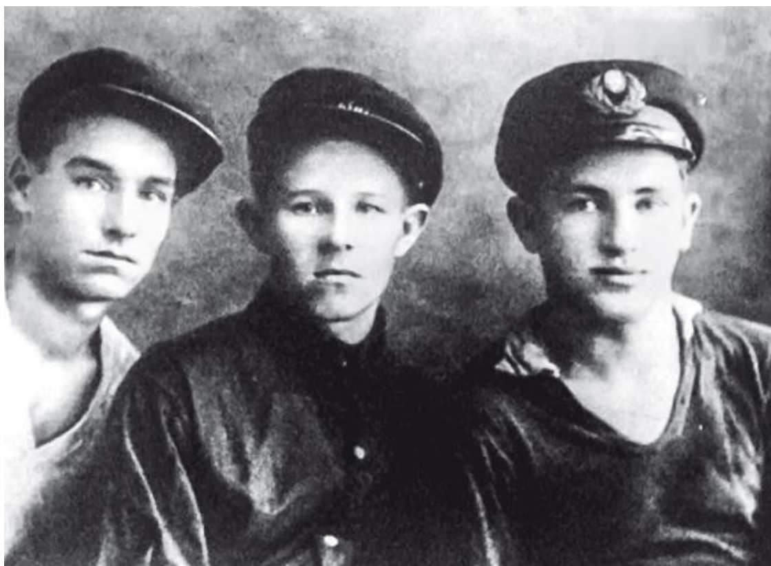
В речном училище Рыбинска, Юрий Андропов – справа

Да, безусловно, были среди комсомольцев той поры и отдельные беспринципные приспособленцы, лицемеры и карьеристы, поскольку и такие субъекты в определенной пропорции также воспроизводятся или воспитываются матерью-природой.