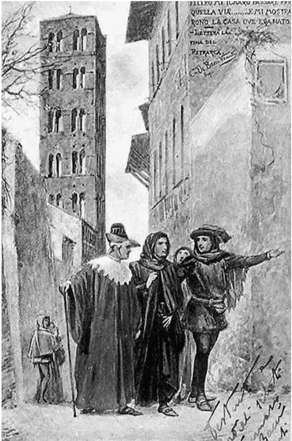
Группа заговорщиков (в центре Данте), которая пробирается по городу под покровом ночи. Средневековый рисунок