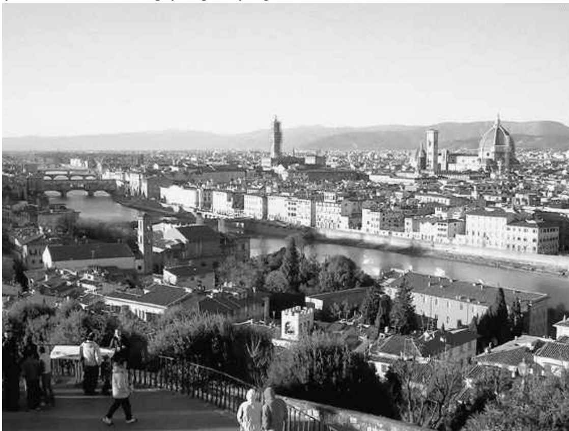
Вид с холма Сан-Миньято

Прежде чем начать прогулку по улицам и площадям тосканской столицы, стоит вспомнить Макиавелли и подняться на холм Сан-Миньято, откуда Флоренция видна целиком как на ладони. Воздух в здешних местах почти всегда сухой и прозрачный, поэтому четко просматривается даже то, что лежит у горизонта, то есть на северо-западе, где долина расширяется, открывая взгляду самую старую часть города – так называемый сакральный центр. Его легко узнать по колоссальному куполу храма Санта-Мария дель Фиоре, стоящего в окружении подобных ему шедевров архитектуры. С северо-востока к старым кварталам подступают Северные Апеннины, в этом месте невысокие, покрытые зеленью, которая вместе с синевой неба усиливает и без того яркую красоту строений.