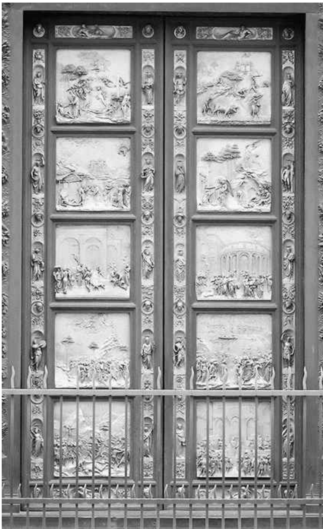
...и Porta di Парадизо – Райские врата Гиберти