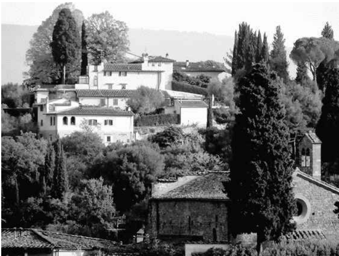
Одно из предместий Флоренции, теперь уже без замков, но с красивыми виллами