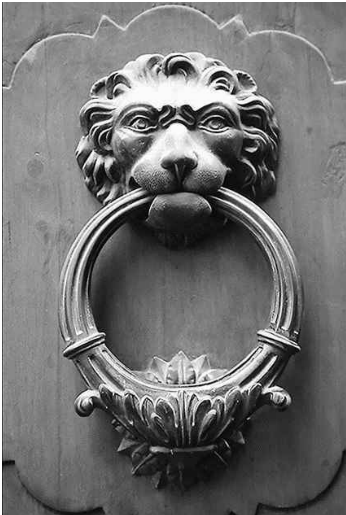
...и железных – в виде дверных ручек

После падения империи Флоренция не раз подвергалась набегам варваров. В V–VI веках ее опустошали остготы, предводительствуемые королями Радагезом и Тотилой. В 541 году тосканскую столицу захватили вестготы, затем пришли лангобарды, с которыми горожанам уда-