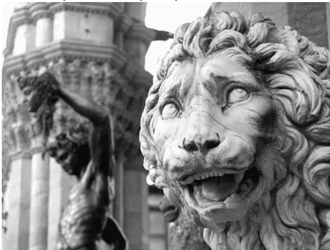
О римском прошлом города свидетельствует обилие каменных львов в виде уличной скульптуры

Правильный квадрат (каждая сторона около 0,5 км) античной Флоренции, как и пересекающиеся под прямым углом главные улицы, стал основой совсем другого, уже средневекового города. Однако римская планировка сохранилась и даже сегодня заметна в расположении кварталов, примыкающих к Арно. Окруженная толстыми стенами, Флоренция занимала удобное место на оживленной дороге из Рима в Болонью, соединявшей ее с севером Италии. Путь проходил прямо через город, направляясь по центральной улице к реке, где находилась переправа, на месте которой позже был построен Старый мост (итал. Ponte Vecchio).