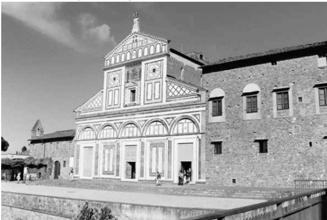
Церковь Сан-Миньято на горе

Одним из лучших произведений проторенессансного искусства ныне считается храм Сан-Миньято на горе, где некогда располагались Верхние Фезулы и где, по легенде, принял мученическую смерть святой Миньято. Церковные анналы называют этим именем армянского царевича, служившего в римском легионе и погибшего от рук варваров, не пожелав отречься от христианской веры. Часовня на месте его казни стояла еще с античных времен, а в 1018 году вместо полусгнившего деревянного строения заботами епископа Гильдебранда появилась каменная базилика, то есть собственно храм Сан-Миньято. Вначале он принадлежал монахи-ням-бенедиктинкам, но с 1373 года стал собственностью мужского братства того же ордена. Его строили, перестраивали и украшали еще 300 лет, пока фасад не приобрел благородный вид отчасти из-за формы, но в большей мере из-за цвета: облицовка белым и зеленым мрамором усилила яркость красок настенной мозаики «Христос на троне между Марией и Миньято». Конструктивной особенностью здания стали арки нижнего яруса, чьи пропорции вместе с приемом наложения на стену создали ощущение легкости.