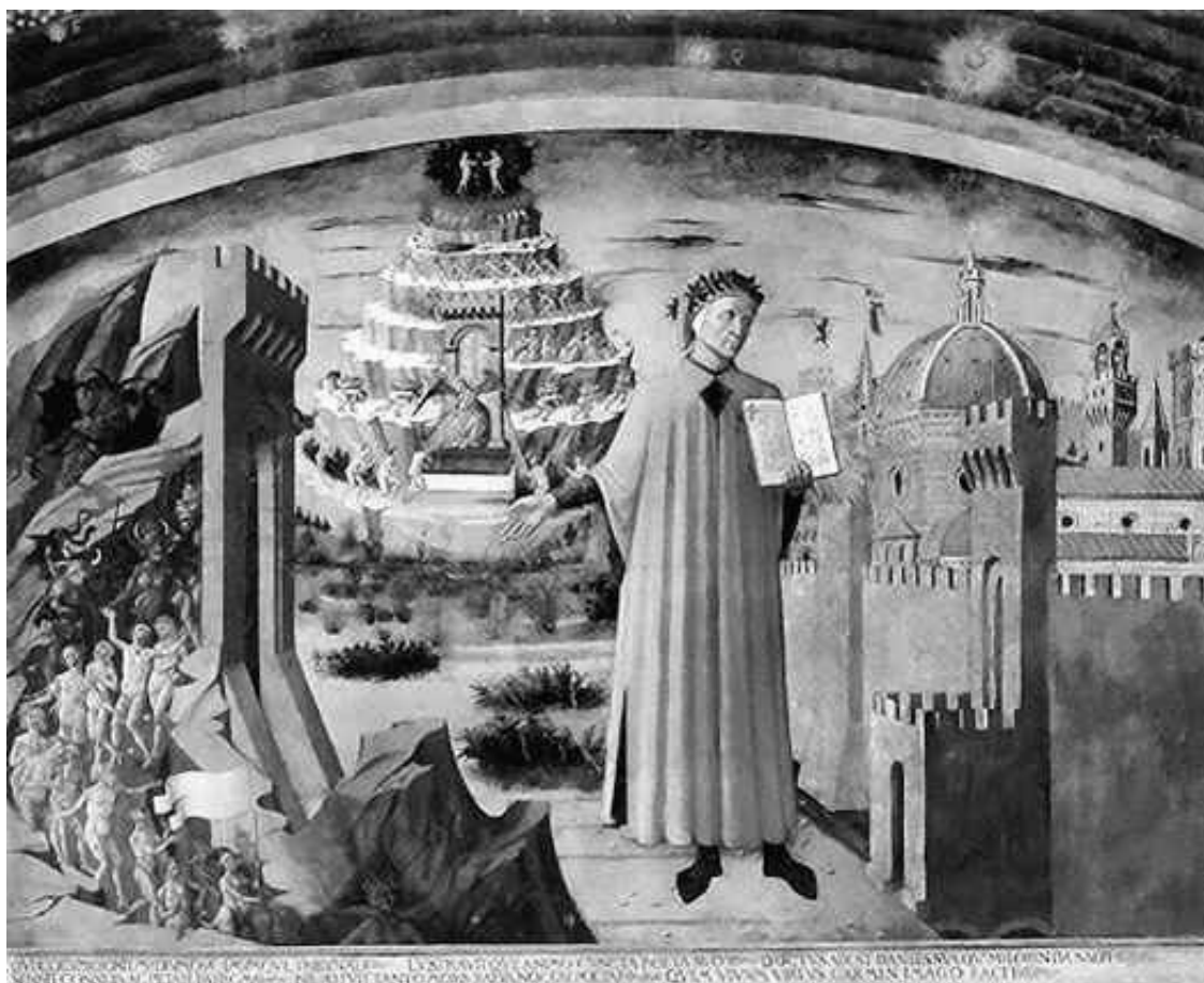
Данте, изображенный на фоне родной Флоренции

Именно таким, красивым и уютным, запомнил баптистерий крещенный в нем весной 1265 года Данте Алигьери. Находясь в изгнании, великий поэт тосковал о «милом Сан-Джованни» так же сильно, как о безвременно сошедшей в могилу Беатриче, которая умерла, будучи женой банкира Симона Барди, так и не побывав в его объятьях. Современники Данте заходили в церковь через южные, обычно всегда распахнутые двери со створками работы Андреа Пизано. Составленные из 28 рельефных панелей из бронзы, они представляли взору сцены из жизни Иоанна Крестителя и связанные с ним изображения основных добродетелей.