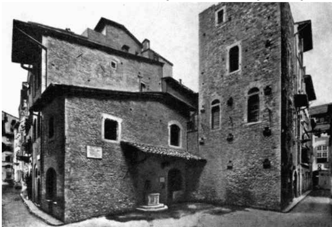
Каптановая башня – место заседаний глав Флорентийской коммуны

Однако, если вспомнить Макиавелли, «как в теле человеческом, чем в более пожилом возрасте завладевает им болезнь, тем она опаснее и смертельнее, так и во Флоренции жители поздно разделились на враждующие партии, зато больше пострадали от этого разделения». О причине первых раздоров соотечественникам поведал местный летописец Джованни Виллани в своем сочинении «Новая хроника или История Флоренции»: «...в 1177 году во Флоренции началась великая, доселе небывалая война между гражданами. Причины ее заключаются в привычке к слишком сладкой и безбедной жизни вкупе с гордыней и неблагодарностью. Дело в том что семейство Уберти, как самые могущественные и влиятельные граждане города, вместе со своими сторонниками из числа нобилей (знати) и пополанов (народа) взялись бороться с консулами, правителями и вождями коммуны, избираемыми на определенный срок и с определенными полномочиями, видимо, от зависти к неугодным им избранникам. Война была столь беспощадной и ожесточенной, что ни дня не проходило без стычек в разных кварталах...».