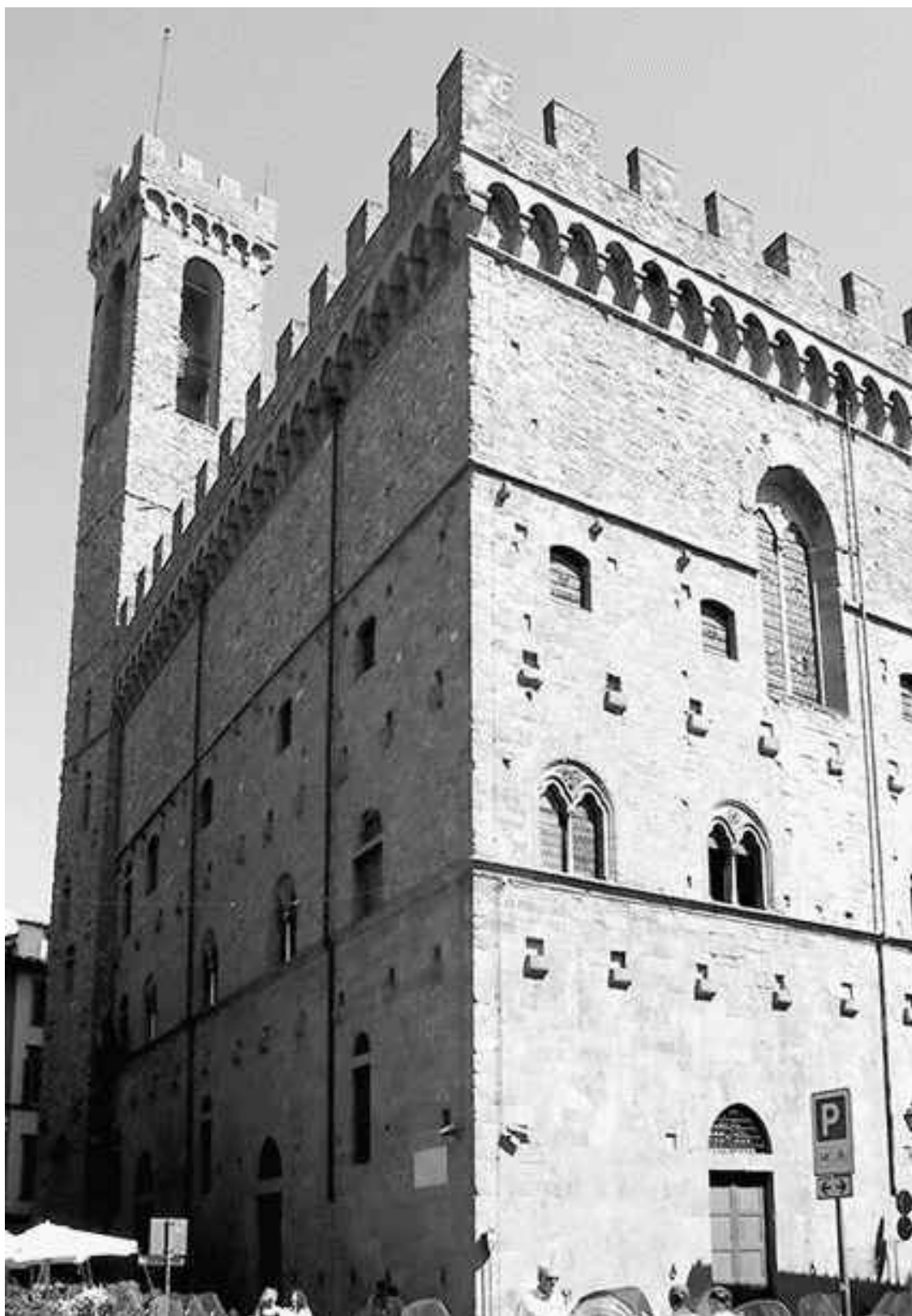
Барджелло – дворец капитано дель popolo