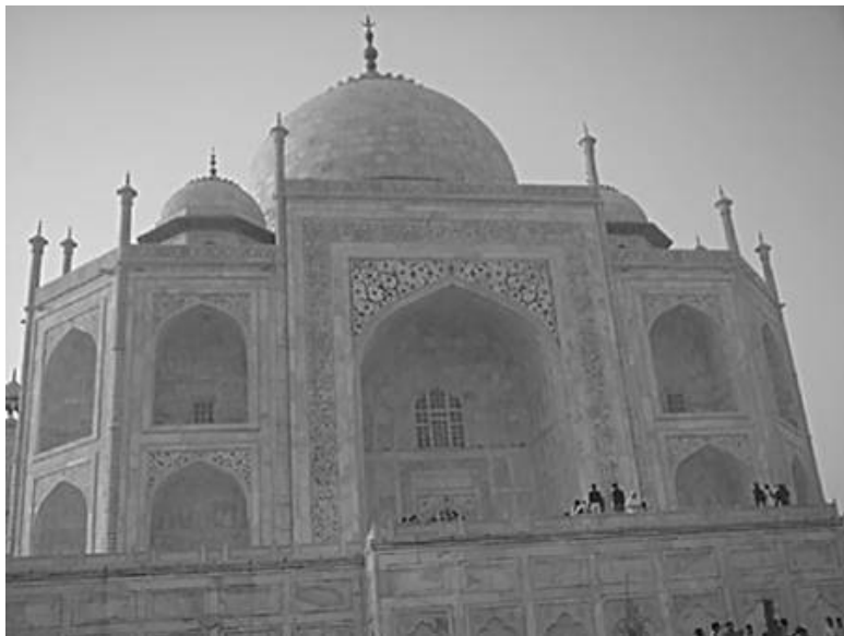
Мавзолей Тадж-Махал в Агре

Листая страницы, читатель будет шаг за шагом идти сквозь века по основным вехам развития индийской архитектуры и искусства, венцом которых стал знаменитый мавзолей Тадж-Махал.