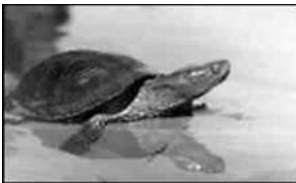
Болотная американская черепаха

Американская болотная черепаха по размерам и окраске напоминает европейскую болотную. Ее карапакс окрашен в темно-оливковый цвет с маленькими светлыми пятнами, брюшной щит светлый. У взрослых видов щит очень подвижен в поперечной связке – может подтягиваться, плотно закрывая переднее и заднее отверстия панциря при втянутых конечностях. Благодаря этой удивительной особенности американскую болотную черепаху иногда называют полукоробчатой.