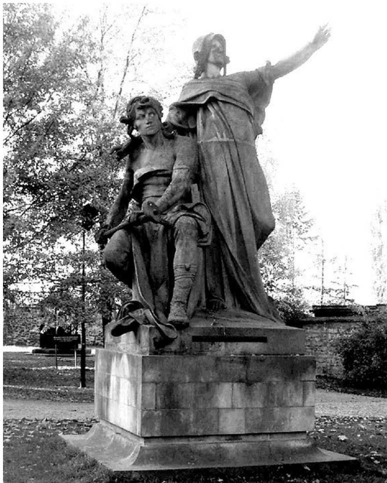
Пржемысл и Либуше. Скульптор Й. В. Мыслбек. Прага, Вышеград