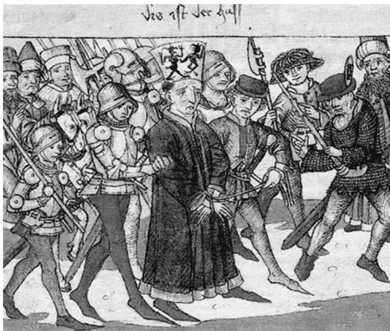
Яна Гуса ведут на казнь. Старинная миниатюра

Выбрасывание из окон, получившее название «дефенестрация», и впоследствии применялось жителями Праги в отношении неудобных чиновников и стало своеобразным национальным сигналом к началу восстания.