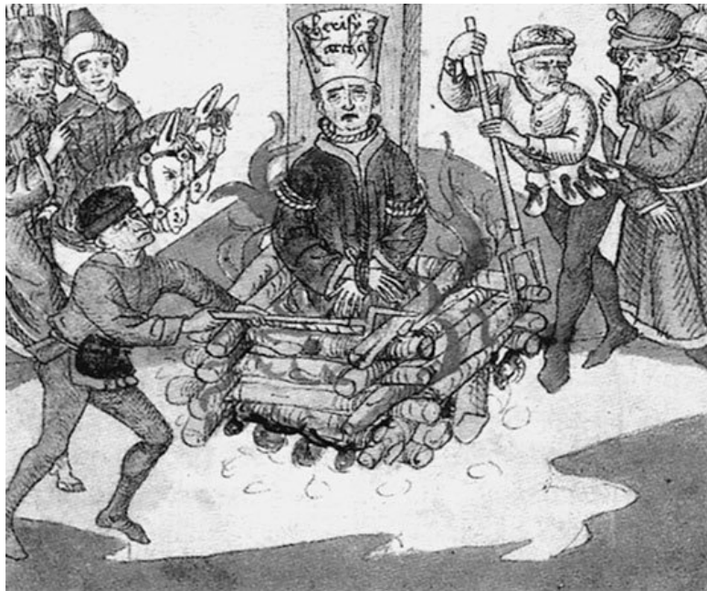
Казнь Яна Гуса. Старинная миниатюра