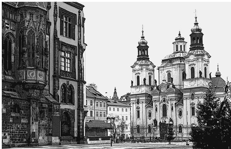
Костел Св. Микулаша

Нове Место располагалось южнее Старого и соединилось с ним тремя основными улицами: Спальной, Вацлавской и Гибернской, которые вели к Скотному, Конскому и Сенному рынкам соответственно. Эти улицы соединялись поперечной дорогой.