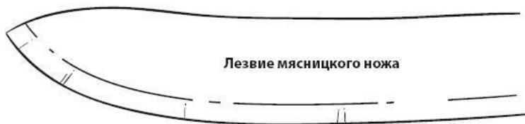
Лезвие мясницкого ножа