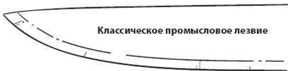
Классическое промысловое лезвие