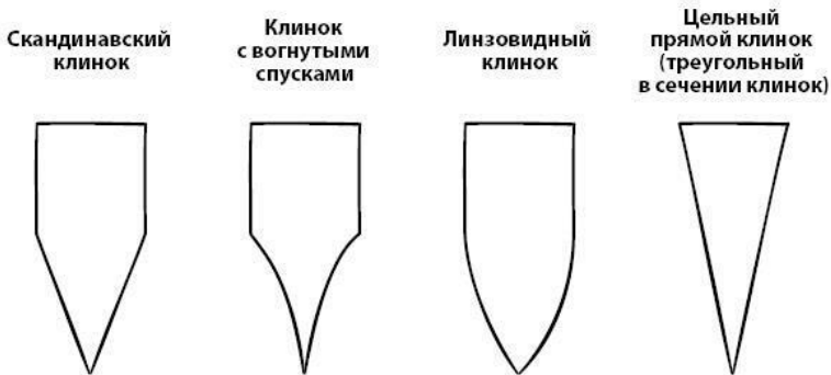
Основные виды заточки клинка