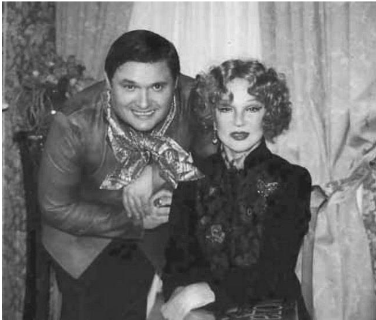
С Людмилой Гурченко, 2005