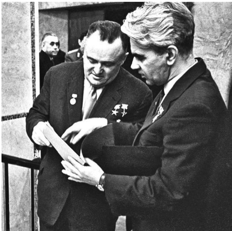
Главный конструктор Сергей Королёв и академик Мстислав Келдыш (слева направо), 1956 год

Главный теоретик и Главный конструктор. Мстислав Келдыш и Сергей Королёв. Я долго искал образ, который смог бы выразить отношение Келдыша к науке. И объяснить, почему он стал служить именно ей.