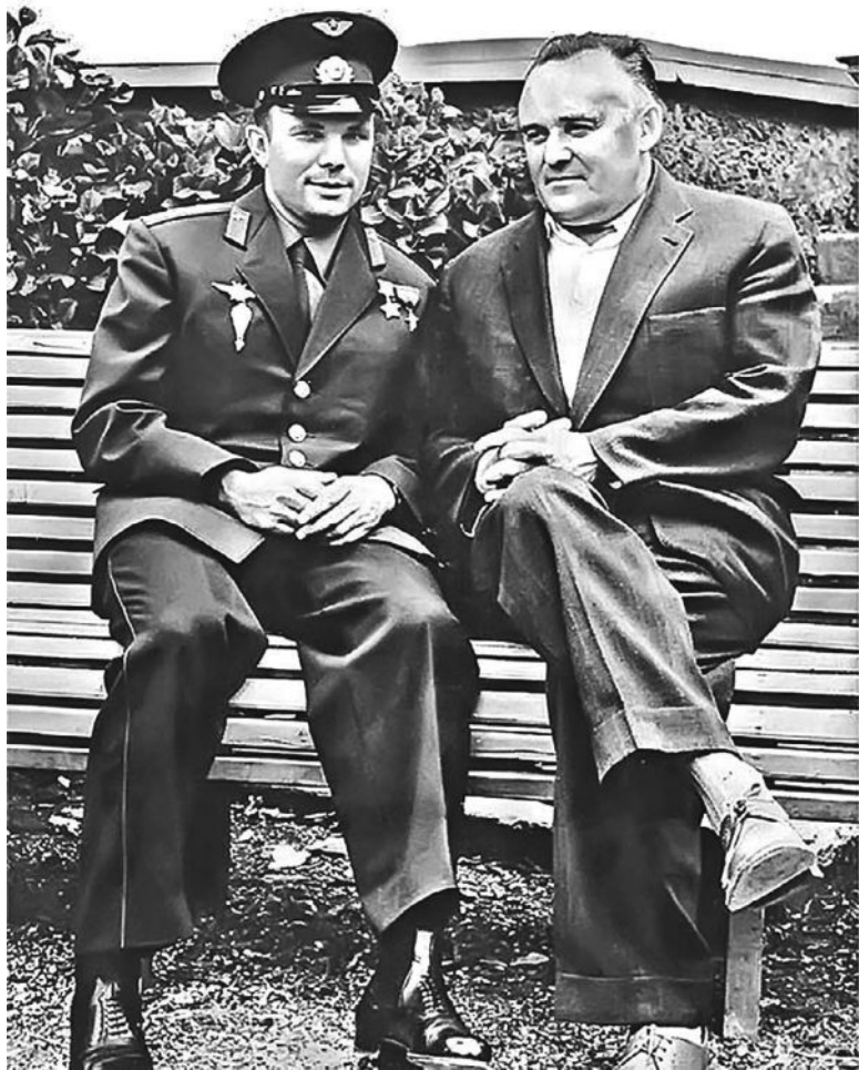
Юрий Гагарин и Сергей Королёв