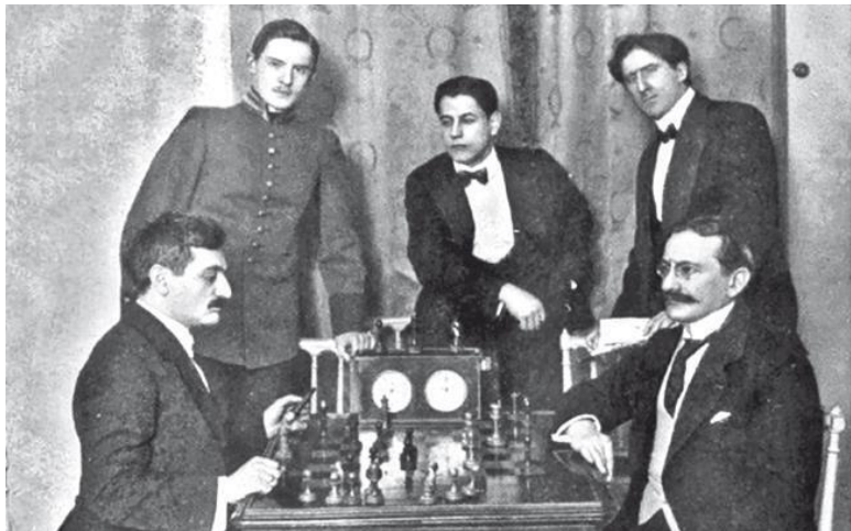
Фото с Петербургского турнира 1914 года, слева направо: Эмануэль Ласкер, Александр Алехин, Хосе-Рауль Капабланка, Фрэнк Маршалл, Зигберт Тарраш

На Кубе не жалели денег на турниры и матчи. Много раз жители острова бывали свидетелями выдающихся схваток полководцев деревянных армий. Капабланка помнил визит в столицу Кубы гениального Поля Морфи и его партии с чемпионом острова – талантливым рабом-негром Феликсом. А совсем недавно Гавану навестил бородатый Вильгельм Стейниц. Во второй раз отбил он здесь попытку русского виртуоза Чигорина отобрать у него шахматную корону. Правда, второй матч Чигорин играл значительно лучше, чем первый. Он уже имел отличные шансы на победу, как вдруг в решаю-