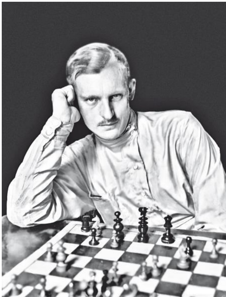
Александр Алехин, 1921 г. После победы во Всероссийской