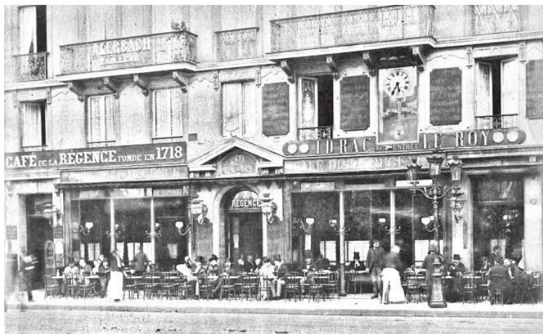
Кафе «Реганс». Начало XX века.

Левая половина витрины была отдана во власть сырам. Колеса швейцарского сыра толкались здесь с круглыми головами сыров голландских; рокфор с голубыми прожилками покровительственно поглядывал из-под стеклянного колпака на обнаженный кантальский сыр и честер золотого цвета. Дальше шли горы фруктов, потом печенье, торты и пирожные с кремом и сбитыми сливками.