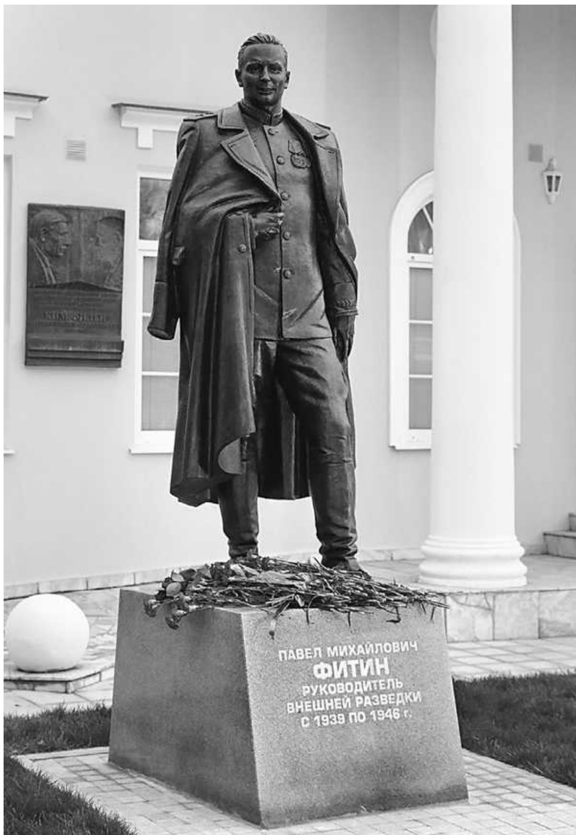
Памятник Павлу Фитину