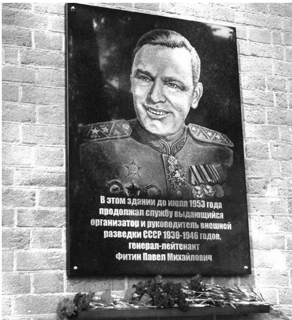
Мемориальная доска на здание Свердловского управления ФСБ

В ходе успешных военных действий и после военной победы известность многих советских военачальников значительно выросла. Авторитет молодых и энергичных «генералов Победы» представлял потенциальную угрозу личной власти Сталина, так как они могли, пусть даже гипотетически, объединиться на антисталинской платформе. Поэтому отменялись торжественные встречи и чествования боевых маршалов в столице, и, наоборот, наиболее авторитетные и информированные руководители целенаправленно удалялись в глубинные районы страны.