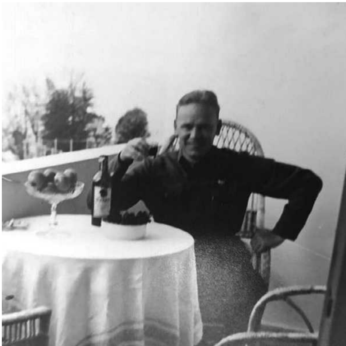
Павел Фитин на отдыхе

Когда я вошел в приемную наркома, там было несколько человек. Вскоре прибыли и остальные товарищи. Нас пригласили в кабинет. Нарком был подавлен случившимся. После небольшой паузы он сообщил, что на всем протяжении западной границы – от Балтики до Черного моря – идут бои, в ряде мест германские войска вторглись на территорию нашей страны. Центральный Комитет и советское правительство принимают все меры для организации отпора вторгшемуся на нашу территорию врагу. Нам надо продумать план действий органов, учитывая сложившуюся обстановку. С настоящей минуты все мы находимся на военном положении, и нужно объявить об этом во всех управлениях и отделах.