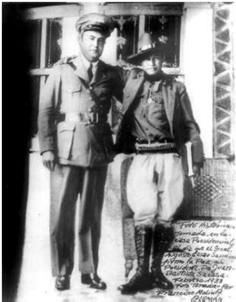
А. Сомоса (слева) и А. С. Сандино (справа) в феврале 1933 года. Аугусто Сесар Сандино Кальдерон (исп. Augusto