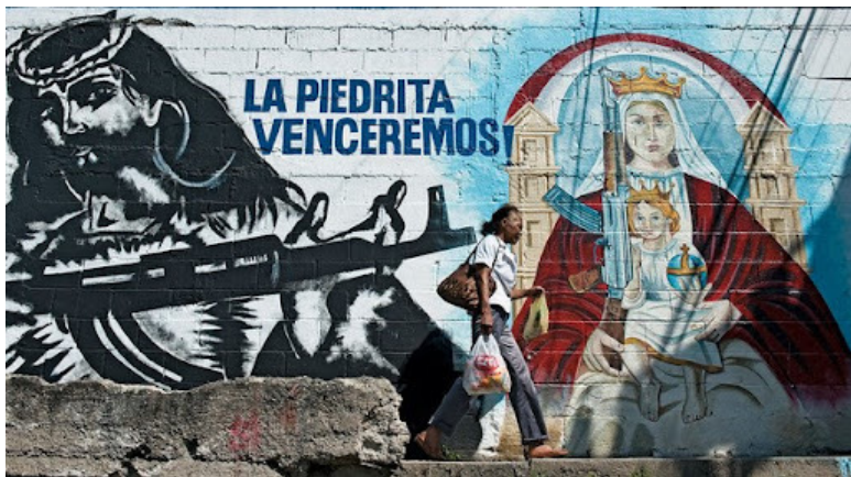
Граффити в Венесуэле на котором Иисус изображен с автоматом