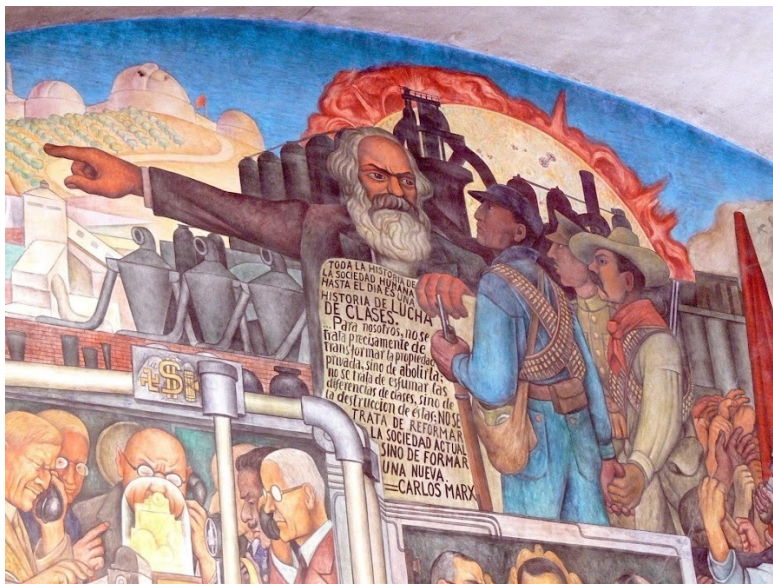
Диего Ривейра. «Карл Маркс указывает путь к будущему». Фрагмент фрески в Национальном дворце Мехико.