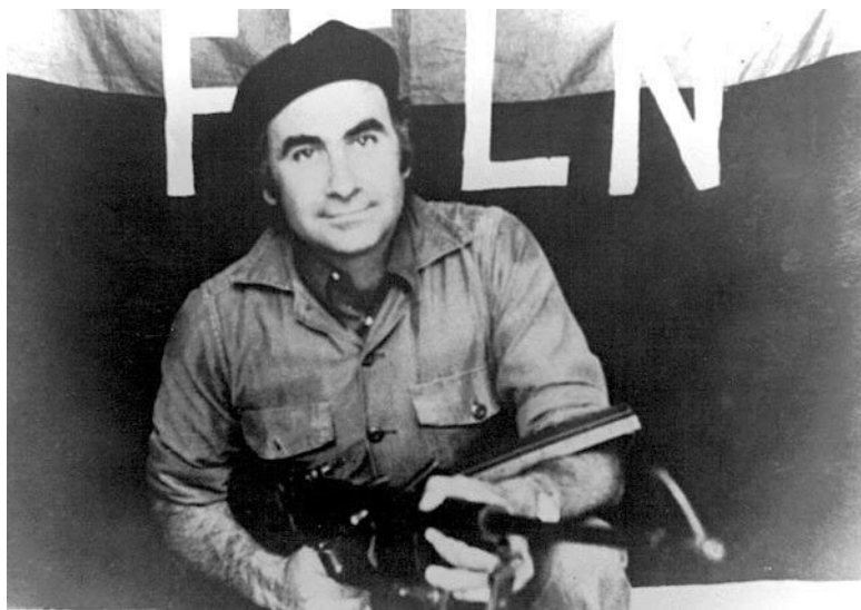
Гаспар Гарсия Лавиана – испанский священник, прибыв-

В борьбе против тирании многие церкви и помещения общин превратились в активно действующие центры сопротивления и солидарности. В Эстелии НХО были особенно активными в организации восстания. Отец Гаспар Гарсия Лавиана был одним из тех священнослужителей, которые сделали решительный выбор в пользу народа.