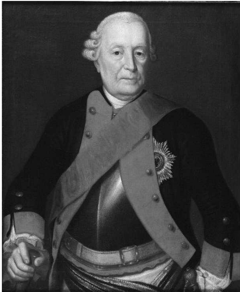
Фельдмаршал Иоганн фон Левальд