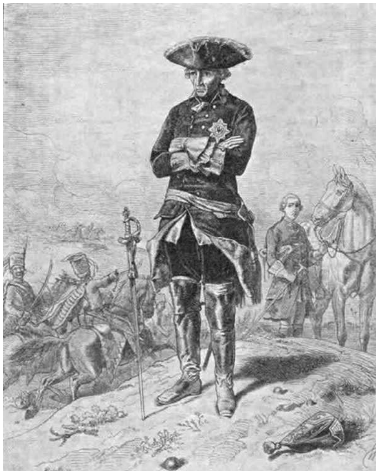
Король Фридрих II