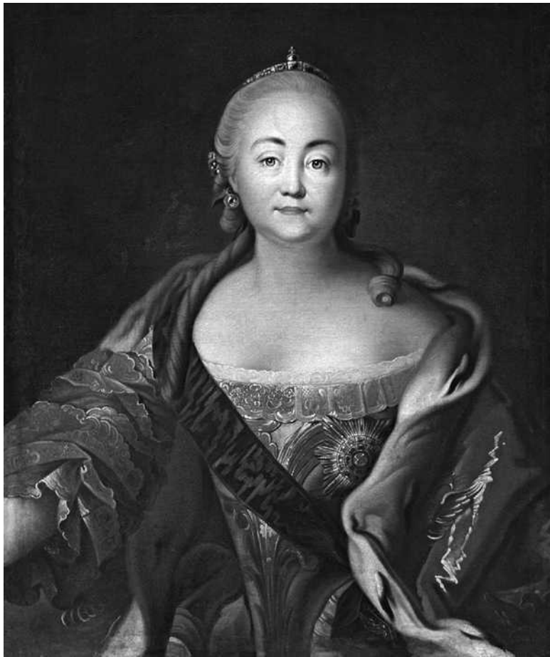
Императрица Елизавета Петровна

Когда автор «Брута» решил стать историком Петра, он об-