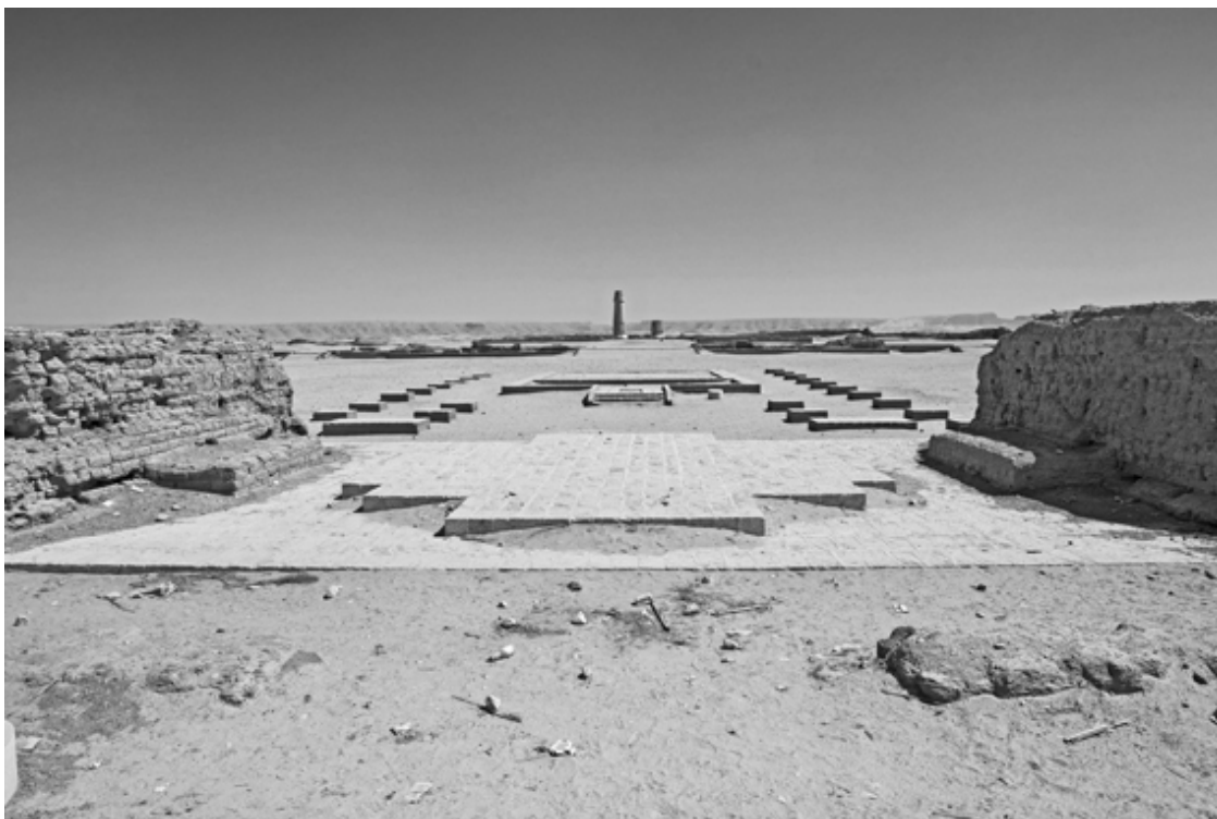
Руины малого храма Атона. XIV в. до н. э. Тель-эль-Амарна, Египет

Эхнатон отступает от привычных идей. Шовинизм – это самое простое оружие. Во все эпохи эта примитивная идеология – самая популярная. Эхнатон избирает непопулярную. Вот эти солнечные лучи, видишь их? Они ласкают всех, люди могут быть разного цвета кожи, но все они должны жить вместе.