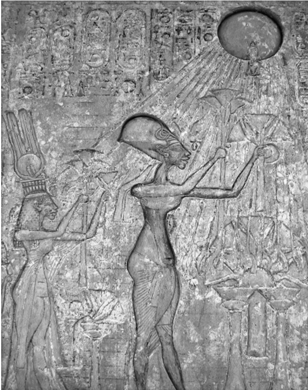
Стела, изображающая Эхнатона и его семью, поклоняющихся Атону или солнечному диску.

Известный французский исследователь и писатель Кристиан Жак 10 написал в 1990-х годах книгу «Египет великих фараонов». Вот в каком патетическом тоне он говорил об учителе Эхнатона: «Его имя переживет века, в то время как имена его современников забудут. Его наследники – не памятники и не дети, а книги, знания, которые он записал... Магическая сила его писаний дойдет до читающего и наставит его на путь истинный». При Аменхотепе III жрец стал видным вельможей и, наконец, учителем будущего фараона. Известно, что он был еще и зодчим – тогда, в древности, было в порядке вещей такое разнообразие талантов и занятий.