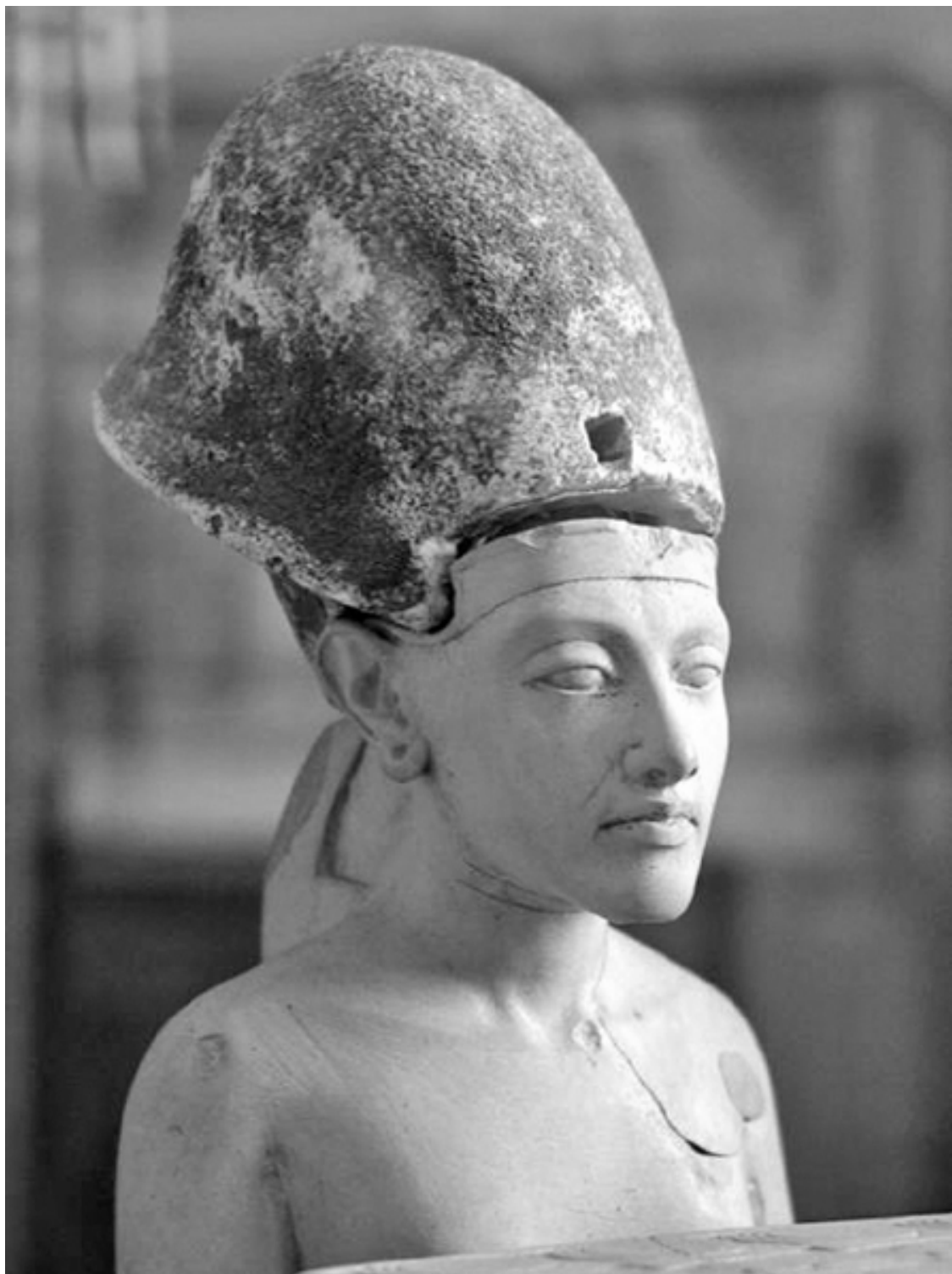
Эхнатон в голубой короне «Хепреш». Ок. XIV в. до н. э. Египетский музей. Каир, Египет

А вот полярная оценка его деяний: «Увы, его собственная жизнь доказала, до какой степени его принципы были нежизненны». И это естественно – слишком велика, экстраординарна фигура! На самом деле споры вокруг Эхнатона будут продолжаться еще и потому, что с его именем связаны серьезнейшие и многолетние археологические изыскания, раскопки, расшифровка текстов. Появляются новые данные, возникают оттенки в воззрениях и суждениях... Так