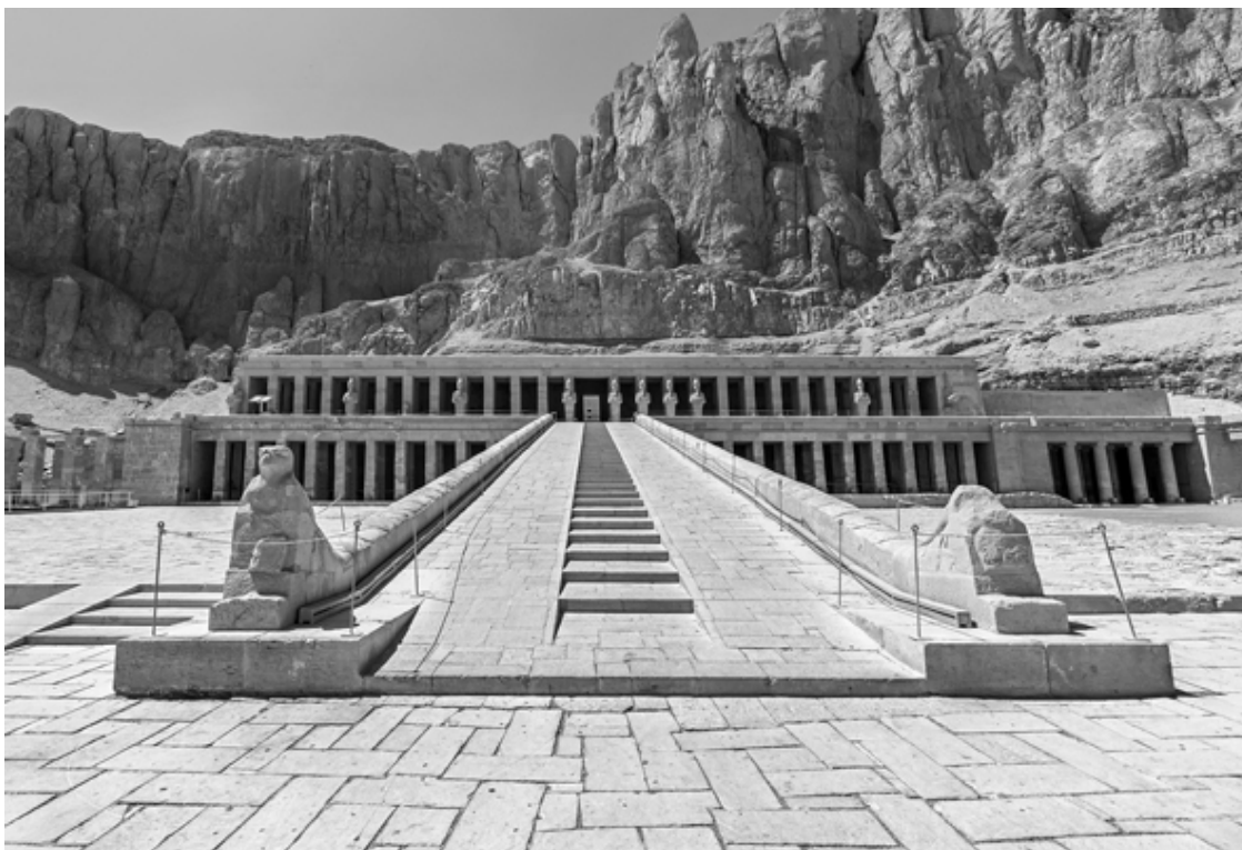
Заупокойный храм Хатшепсут.

Ок. XV в. до н. э. Дейр-эль-Бахри, Египет