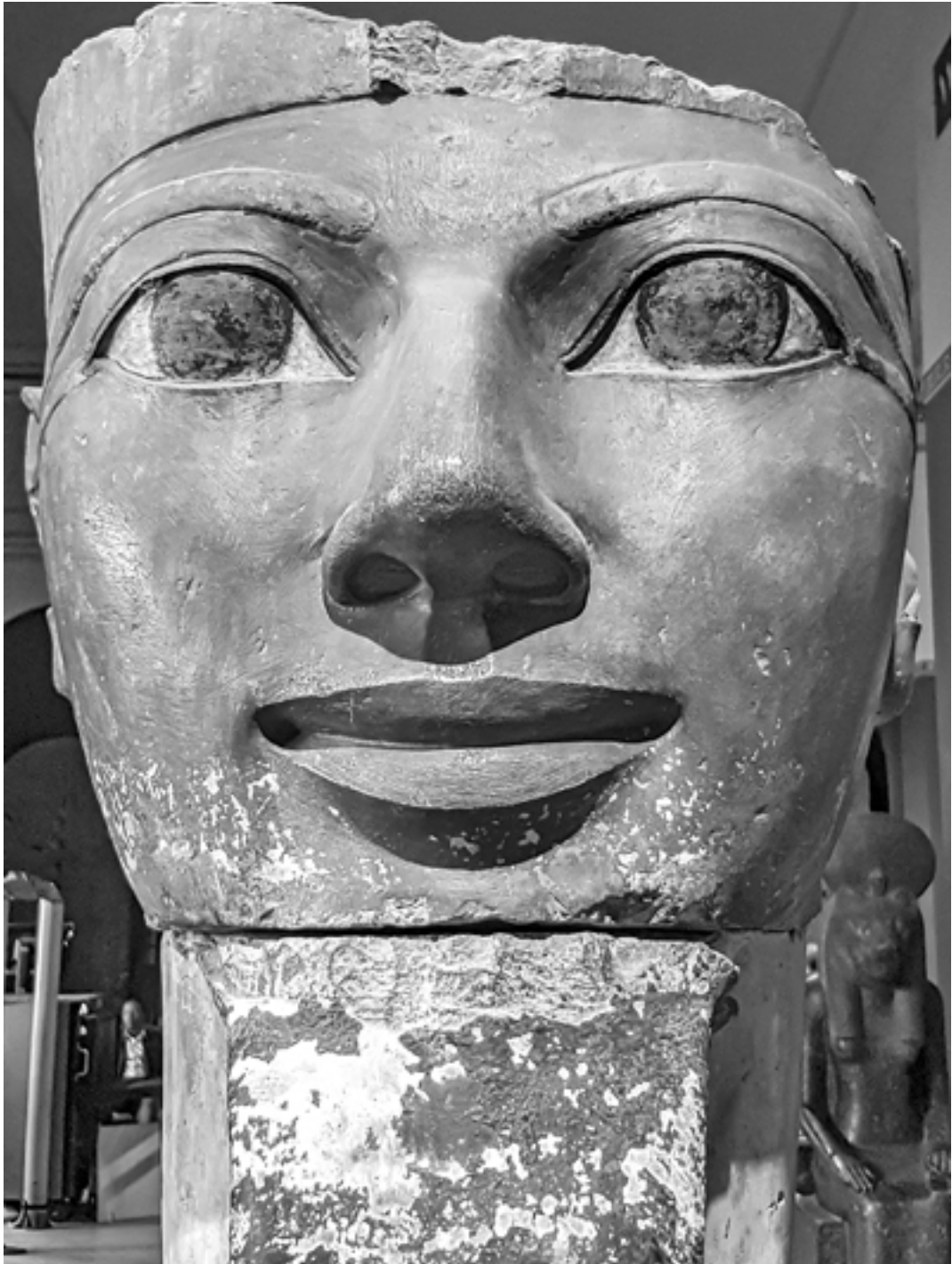
Голова статуи Хатшепсут. XV в. до н. э. Египетский музей. Каир, Египет

Важнее всего для нее было не присоединить территории, а покорить их – продемонстрировать соседям мощь египетского войска, впечатлить их так, чтобы богатства отдали добровольно. И надо признать, это неплохо у нее получалось.