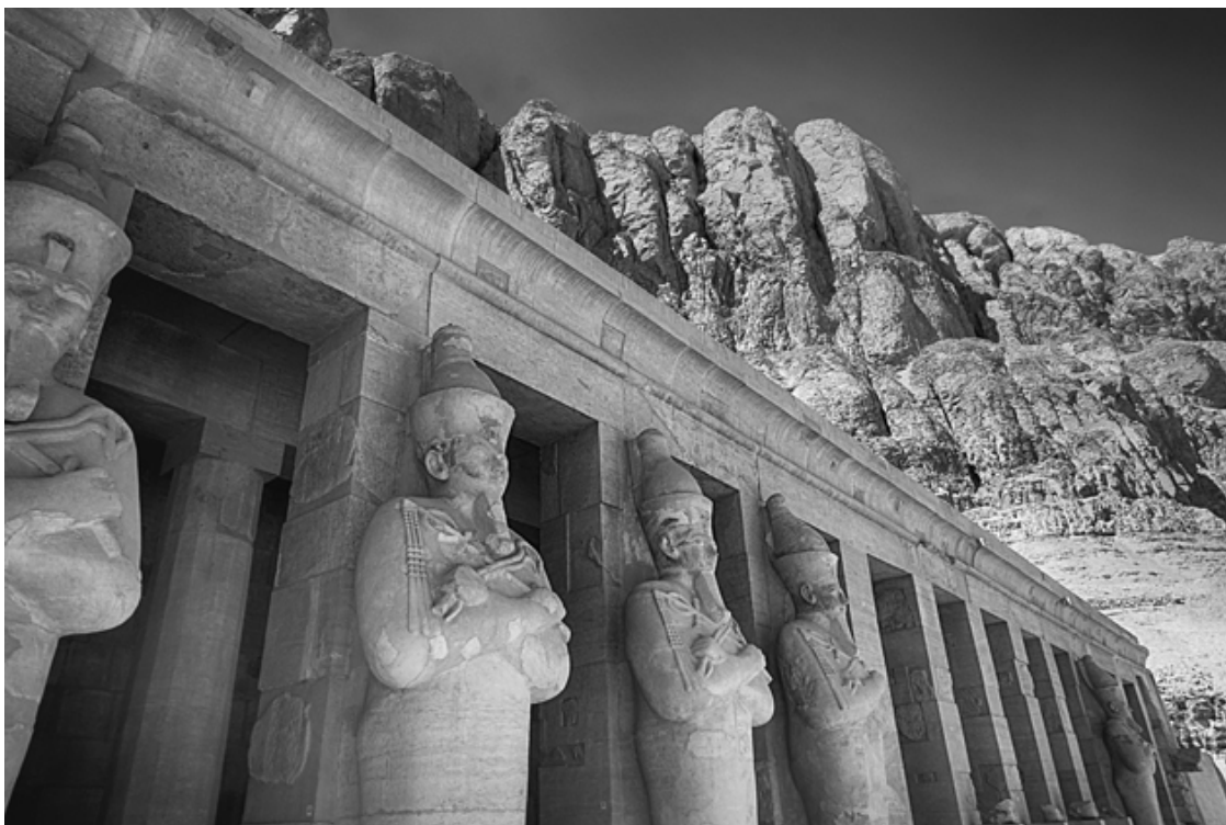
Осирические колоссы в храме Хатшепсут. Ок. XV в. до н. э. Дейр-эль-Бахри, Египет

Сененмут, создававший изображения своей возлюбленной, не мог не показать ее женской красоты. Точно так же через сто лет скульптор Тутмос оказался не в состоянии передать исключительно духовную красоту Нефертити – он воплотил в ее портретах свою любовь. Недаром люди и через тысячи лет сочиняют романы о красавицах Древнего Египта и их поклонниках.