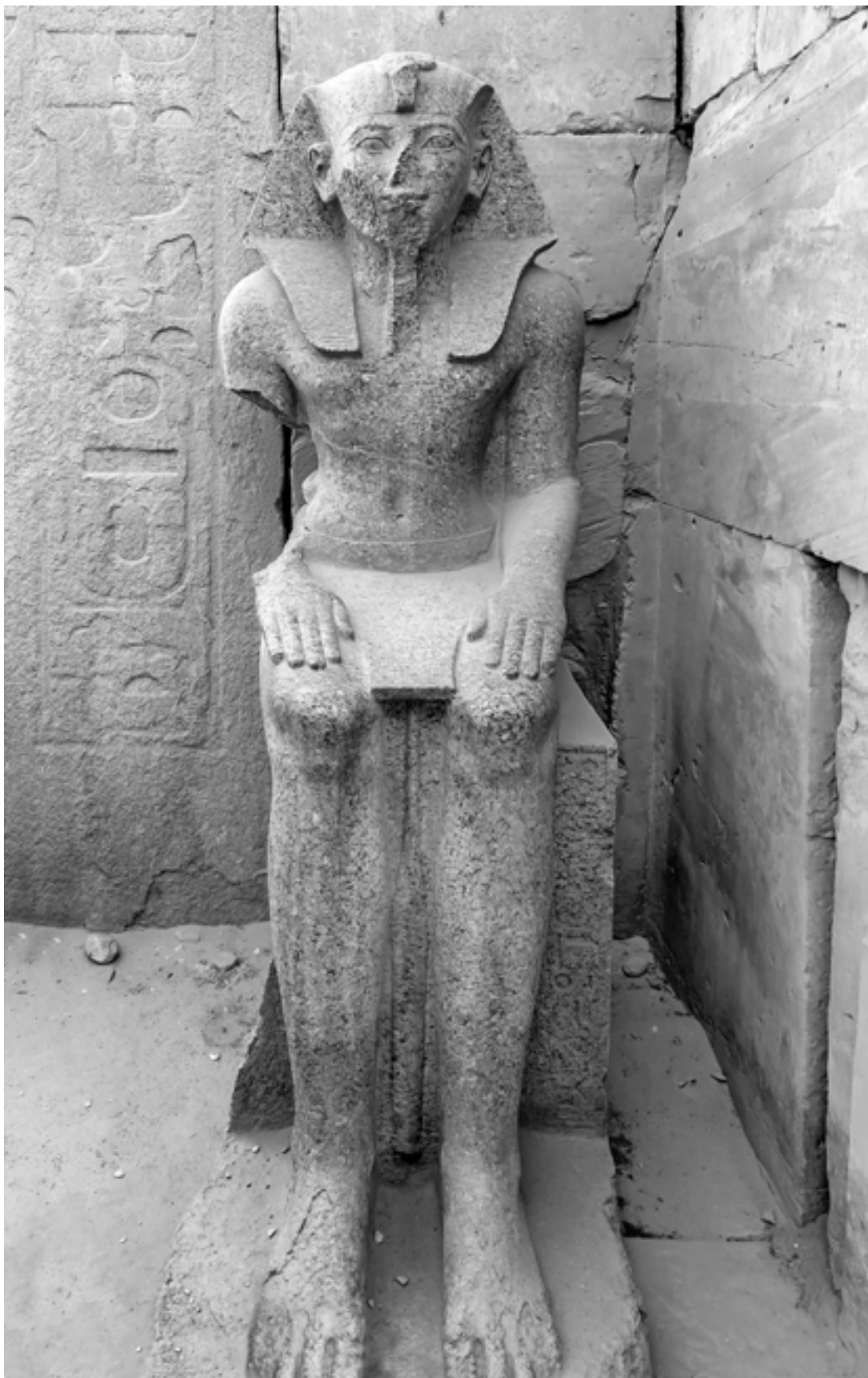
Сидячая статуя Тутмоса III. Храмовый комплекс в Карнаке. Луксор, Египет