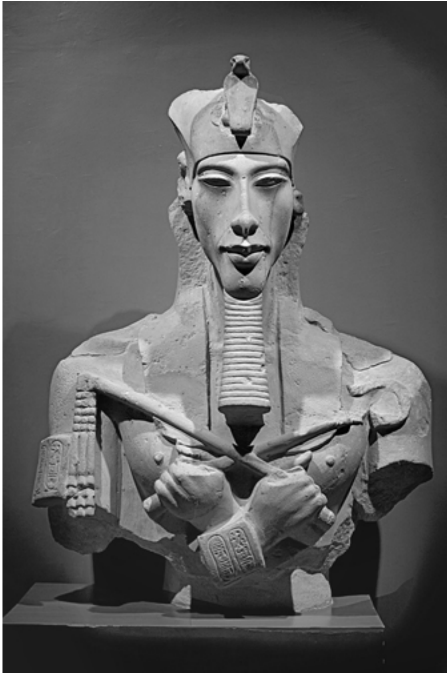
Статуя Эхнатона. XIV в. до н. э. Луксорский музей. Луксор, Египет

В 90-х годах XIX века начались раскопки. Особо нужно отметить старания английского археолога Флиндерса Питри, который посвятил поискам многие годы. И наконец удача. Найдена та новая столица, которая была построена согласно воле и приказу фараона-отступника Аменхотепа IV. Она, как чудо в пустыне, как мираж, выросла стремительно, как по волшебству... и оказалась через тысячи лет раем для археологов. Потому что сразу после смерти Эхнатона появился приказ жрецов Амона покинуть этот город, оставить его навсегда.