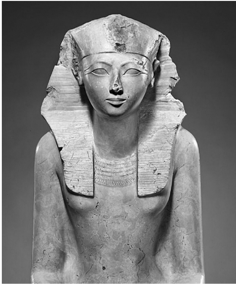
Статуя Хатшепсут. Известняк. Метрополитен-музей, Нью-Йорк, США