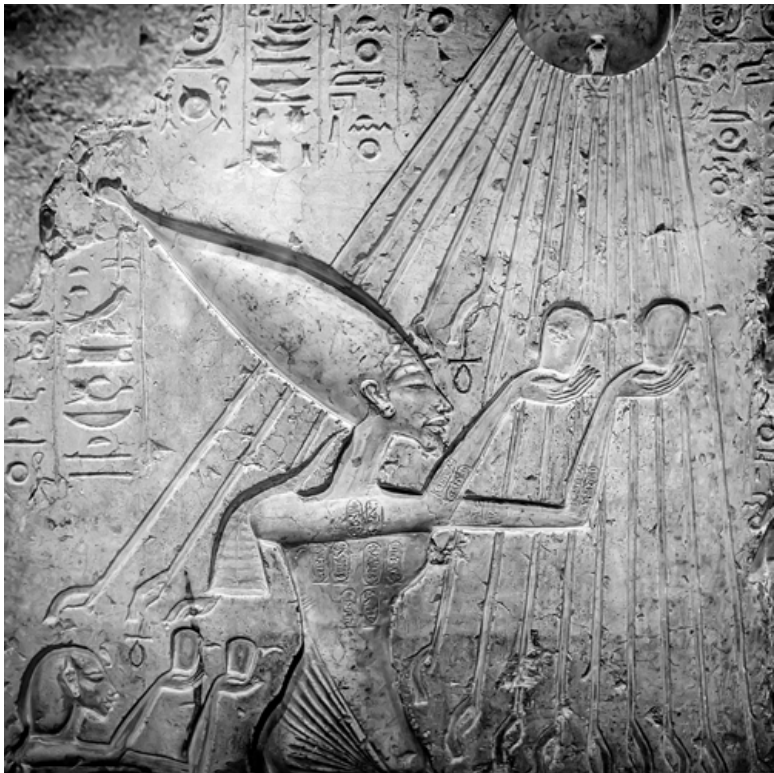
Эхатон поклоняется Атону. Стела. XIV в. до н. э.

Именно после этих похорон что-то происходит между Эхнатом и Нефертити. Разрыв? Они не живут вместе. Она переезжает в загородный дворец. Благодаря раскопкам нам очень много известно о ее жизни там – тихой, мирной, до-