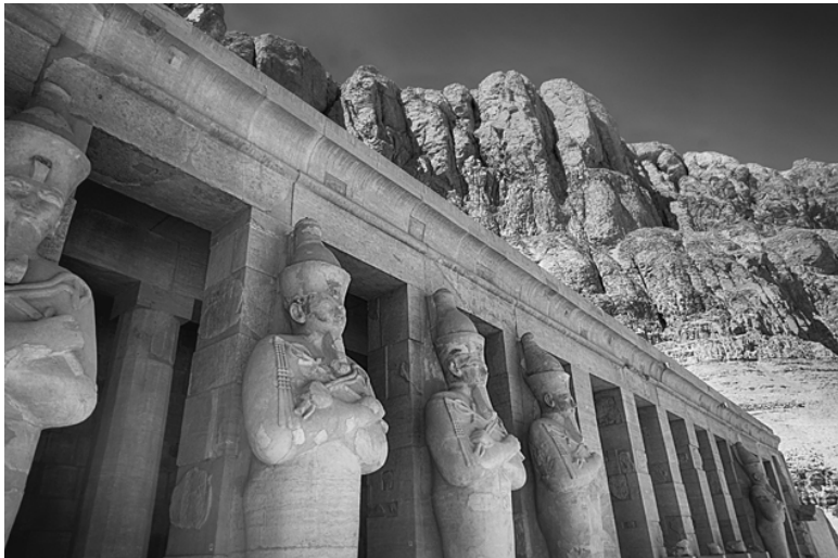
Осирические колоссы в храме Хатшепсут. Ок. XV в. до н. э. Дейр-эль-Бахри, Египет

Сenenмут, создававший изображения своей возлюбленной, не мог не показать ее женской красоты. Точно так же через сто лет скульптор Тутмос оказался не в состоянии передать исключительно духовную красоту Нефертити – он воплотил в ее портретах свою любовь. Недаром люди и через тысячи лет сочиняют романы о красавицах Древнего Египта и их поклонниках.