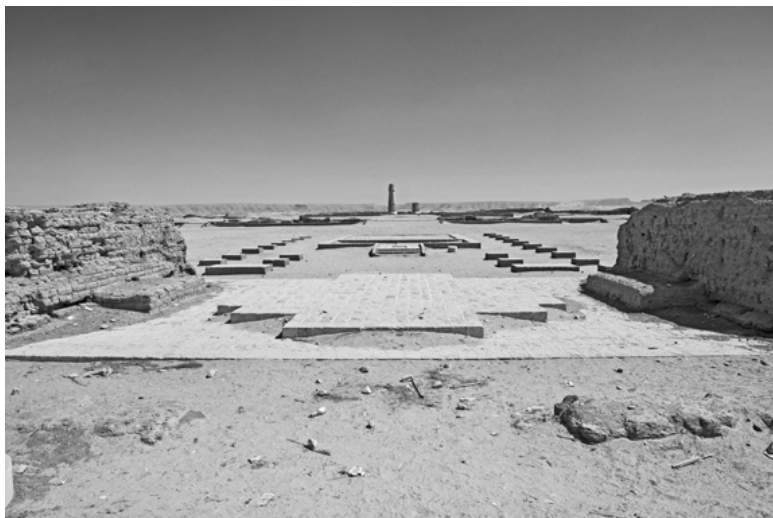
Руины малого храма Атона. XIV в. до н. э. Тель-эль-

сях того времени, только Египет, который называют «страной людей», представляет интерес. За пределами Египта – «страна песка», «презренная страна Куш», наконец, «страна золота» – золотоносная Нубия. Во времена Аменемхетов, Сети, целых династий Египет попирает мощной своей дланью и сильным войском все другие народы. И народы эти ценятся мало. В громадной для своего времени державе обеспечить спокойствие границ было трудно, почти невозможно, народы на окраинах – это, скорее, вассалы, которые платят дань египетскому фараону, боятся его власти, его силы. Как их объединить?