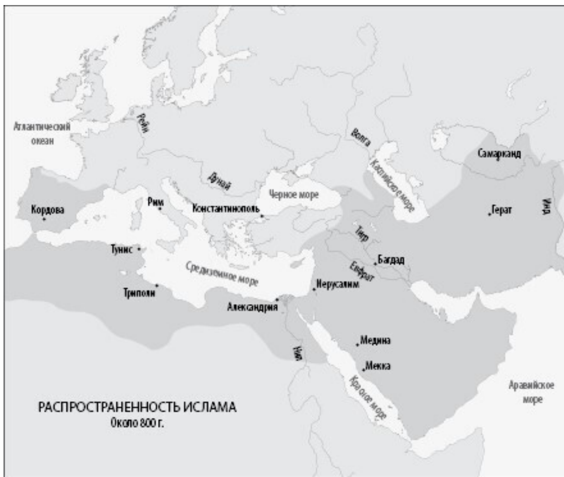
Карта 1.2: Территории, населенные мусульманами, около 800 г. н. э.

док караванной торговли. Однако демографического взрыва попросту не было: его изобрели авторы, считавшие, что для победы над цивилизованными византийцами и персами требовались бесчисленные «арабские орды» 31 . На самом деле все обстояло наоборот. Как мы увидим далее, мусульманские вторжения совершали на удивление небольшие, но очень хорошо организованные и управляемые армии. Что же касается караванной торговли, на ранней стадии существования Арабского государства она могла только вырасти, поскольку караванам ничто больше не угрожало.