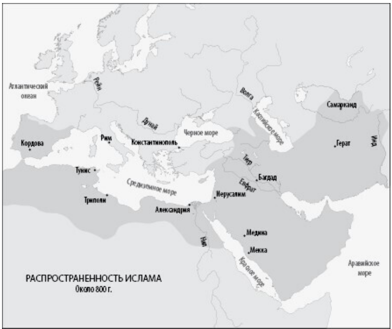
Карта 1.2: Территории, населенные мусульманами, около 800 г. н. э.

Основная причина, по которой арабы именно в это время напали на своих соседей, заключалась в том, что у них наконец появилась такая возможность. Прежде всего и Византия, и Персия были истощены десятилетиями войн друг с другом – войн, в которых обе стороны неоднократно наносили друг другу кровавые поражения. Не менее важно и то, что, превратившись из сборища независимых племен в