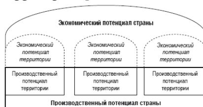
Рис. 1.2. Место производственного потенциала территории в экономическом потенциале страны

Базой экономического потенциала является производственный потенциал, представляющий способность производственной системы производить материальные блага, используя ресурсы производства данной территории ( рис. 1.2 ).