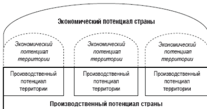
Рис. 1.2. Место производственного потенциала территории в экономическом потенциале страны

В науке существует определенная иерархия потенциалов, высшим из которых является экономический потенциал, включающий в себя ряд структурных элементов. В рамках данного исследования будет рассмотрен один из таких элементов экономического потенциала – производственный потенциал.