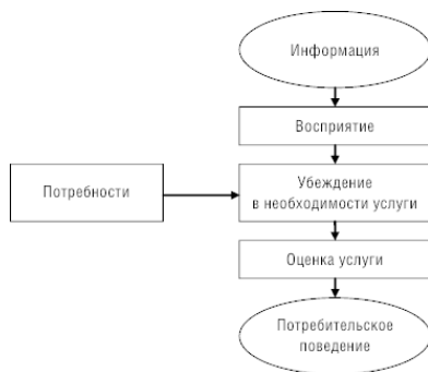
Рисунок 4. Влияние психологических факторов на поведение потребителей

живают психологические, так как их необходимо постоянно исследовать и умело управлять ими на рынке. Все остальные можно определить, исследуя внешнюю среду предприятия, поэтому для исследования причин человеческих поступков и выявления мотивов можно применять различные методы исследования: функциональный, динамический, фундаментальный анализ. Функциональный метод базируется на том положении, что, прежде чем выяснять, почему люди посещают именно это кафе, а не другое, надо узнать, почему они вообще посещают такое заведение. Изучая этот вопрос, необходимо учесть все обстоятельства, которые влияют на принятие данного решения.