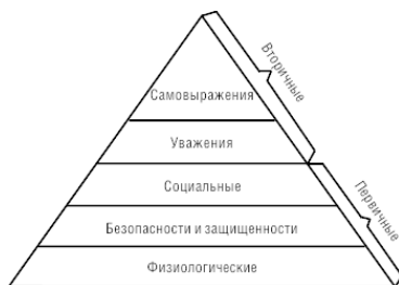
Рисунок 3. Иерархия потребностей по А. Маслоу

Избирательное воздействие означает, что человек воспринимает не всю информацию, а лишь ту ее часть, которая наиболее полно совпадает с его взглядами, сложившимися суждениями и идеями. Имеет место интерпретация информации в соответствии с психологическим состоянием человека, его мнением и убеждениями.