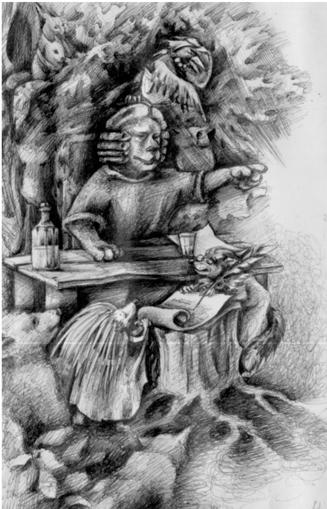
Спросили защитника Зайца.