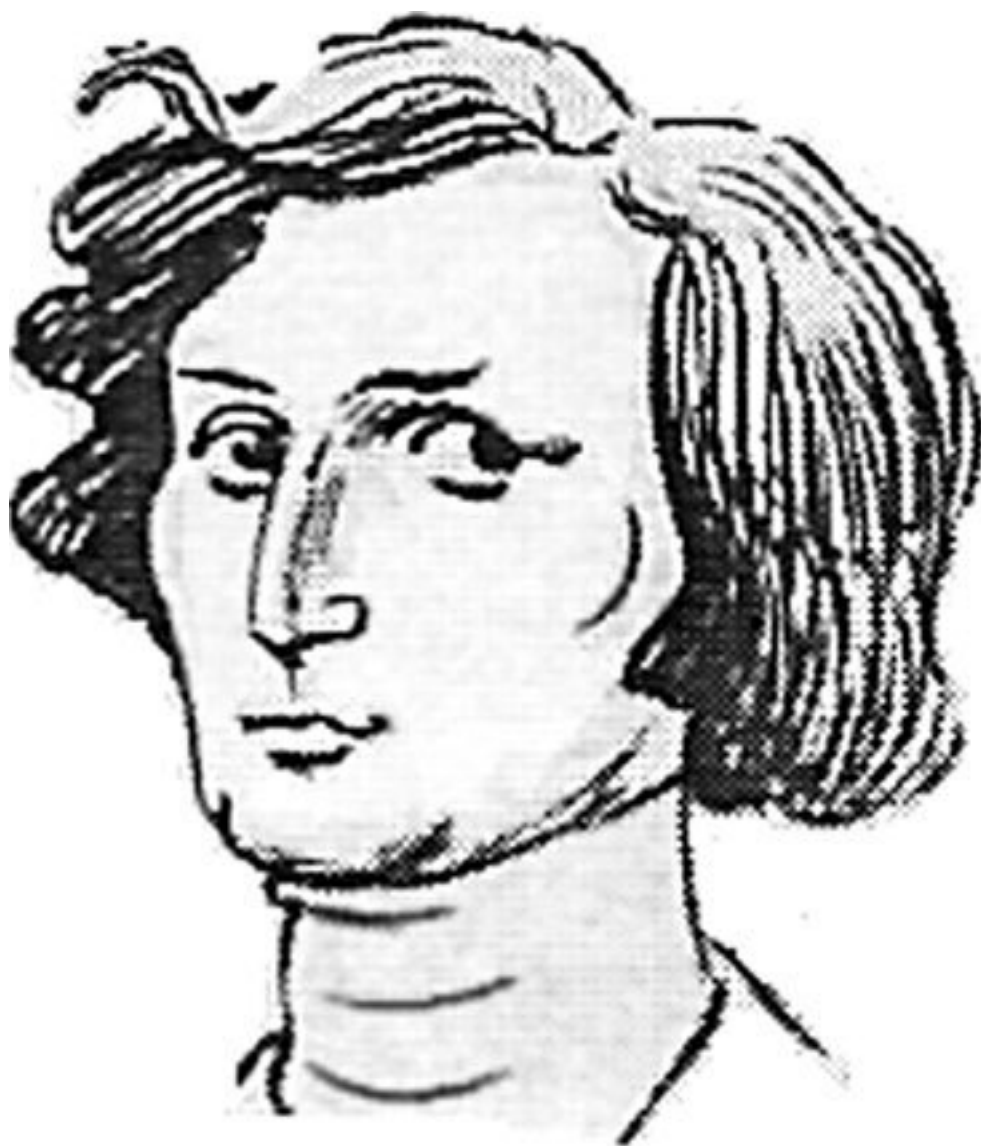
Дружеский шарж. Народный художник СССР Б.Е. Ефимов, 1979