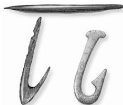
Рис. 3. Крючки, обнаруженные при раскопках

Между тем, как конструкция, рыболовный крючок не всегда был именно крючком, хотя, как приспособление для ловли рыбы, он известен с доисторического периода. Первые его