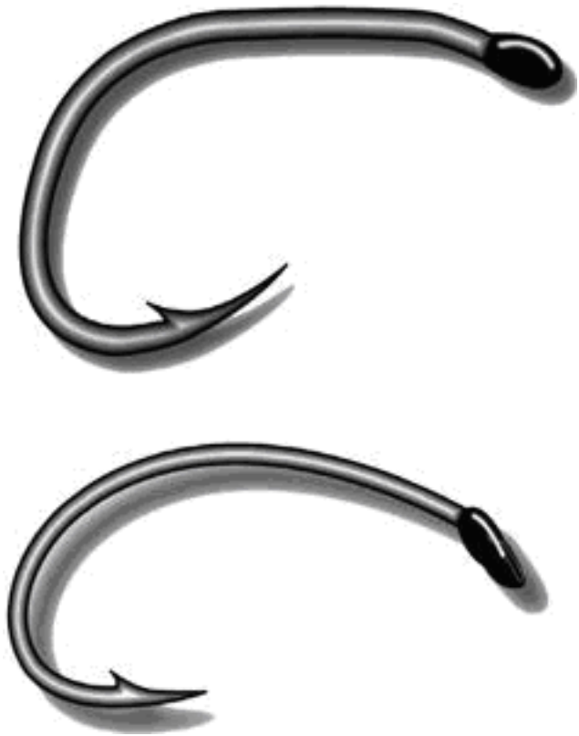
Рис. 4. Нахлыстовые крючки