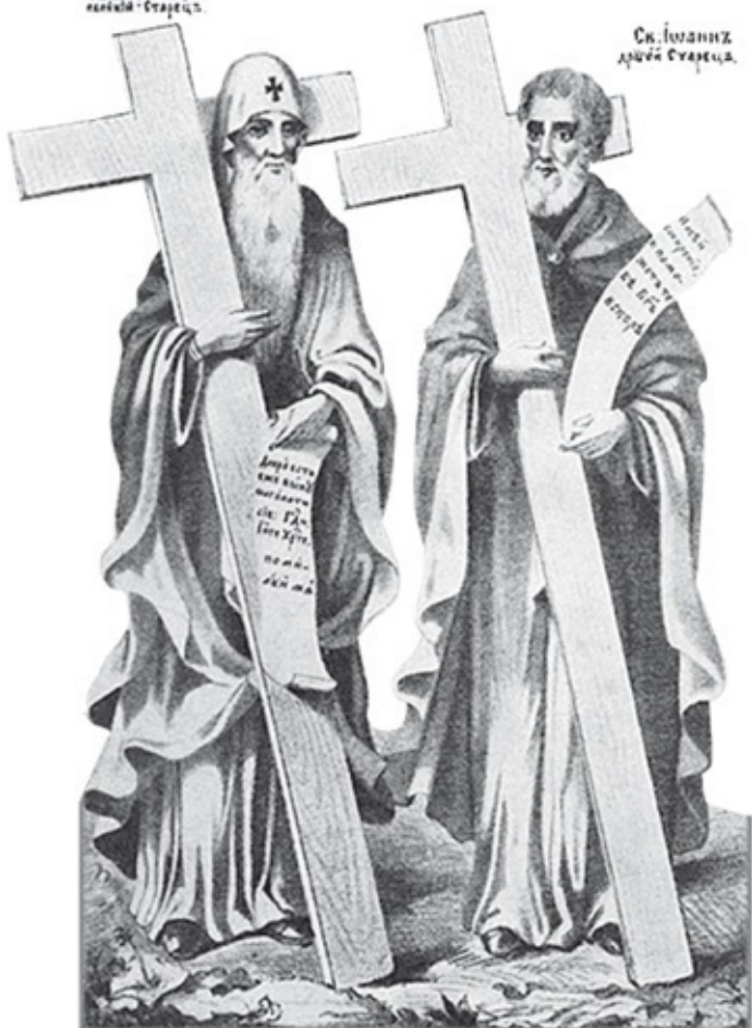
Св. Иоанн Лжепророкъ.