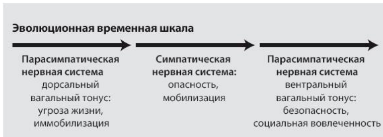
Рис. 1.1 Эволюционно обусловленная иерархия поведения. Из книги Deb Dana «THE POLYVAGAL THEORY IN THERAPY: ENGAGING THE RHYTHM OF REGULATION» Copyright © 2018 by Deb Dana. Использовано с разрешения W. W. Norton & Company, Inc.

Лимбическая система подает сигнал, когда мы чувствуем себя в безопасности, в опасности или в ситуации, угрожающей жизни. Эволюционно обусловленная иерархия поведения связана с этими тремя нейроцептивными состояниями (см. Рисунок 1.1).