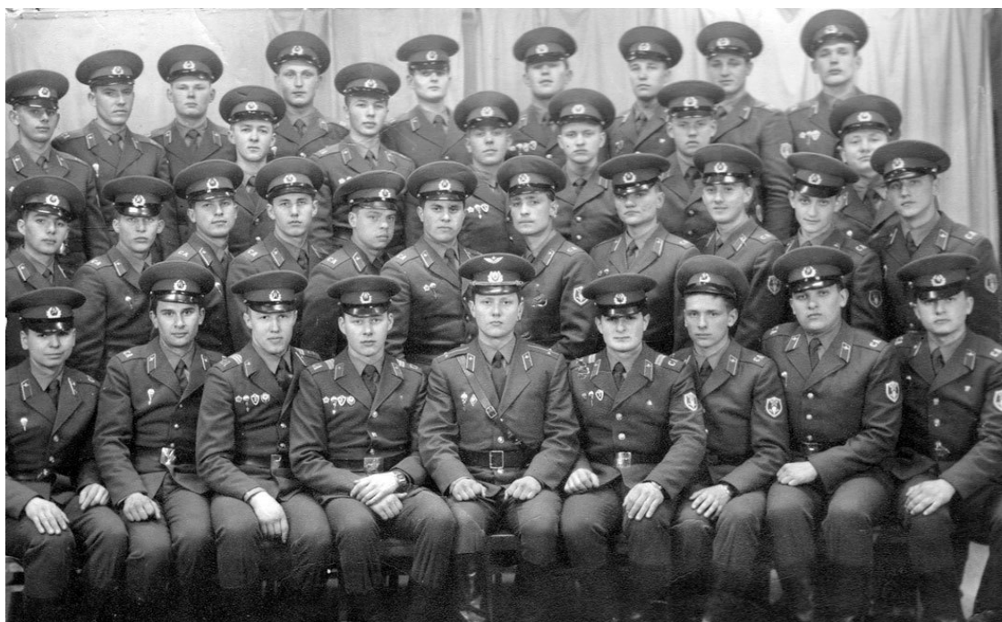
Мой учебный взвод минирования, 1071 упСпН, г. Печоры

Сержантский состав, отобранный из лучших курсантов предыдущих выпусков, имел свою «иерархию». Заместитель командира взвода был реальным начальником для командиров отделений. Сержанты были обоснованно требовательны к курсантам, не спускали ни малейшей провинности. Однако наказания очень редко переходили в плоскость неуставных отношений. По традиции провинившийся курсант повышал свою физическую выносливость. Основа взаимоотношений между курсантами – равенство, и один не мог стать сильнее других, поэтому «качались» повзводно.