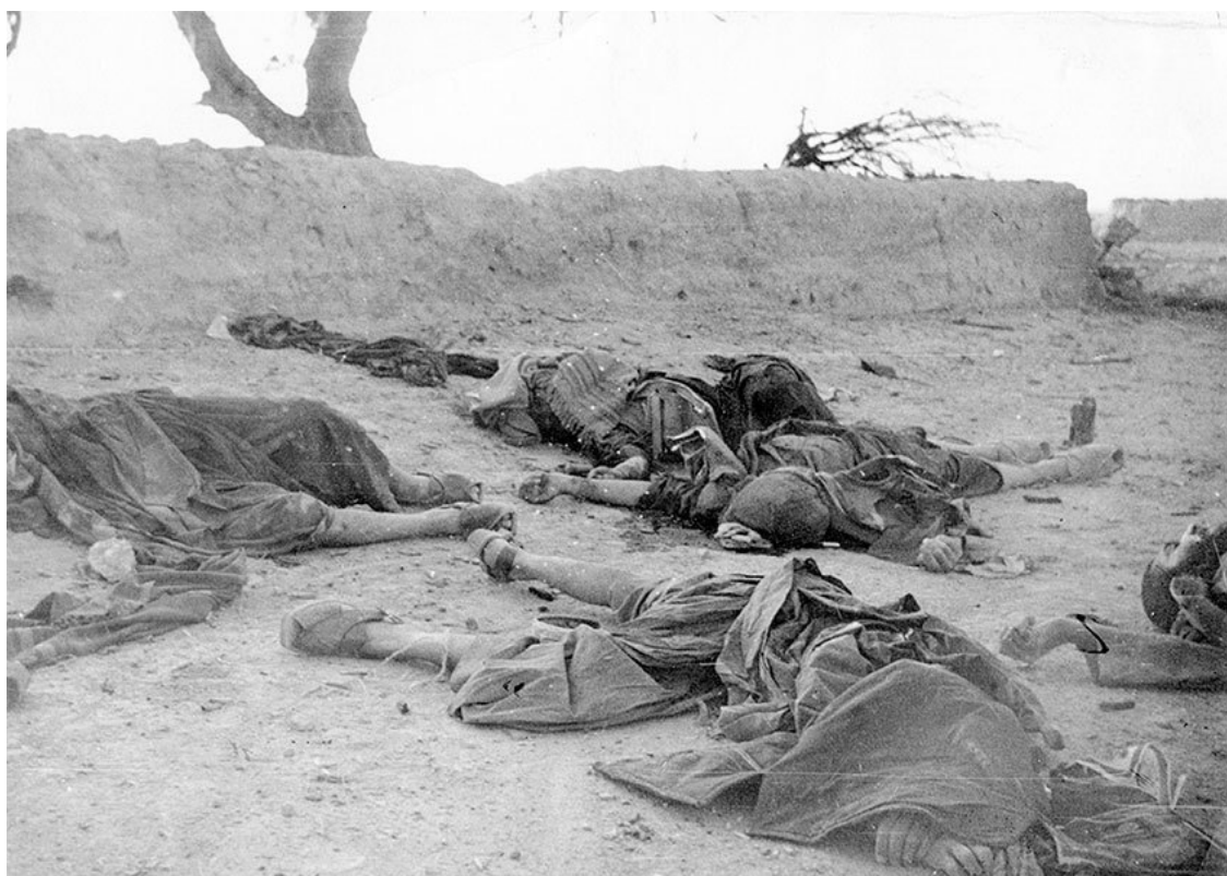
На войне как на войне, уничтоженные спецназом в ночном бою бандиты