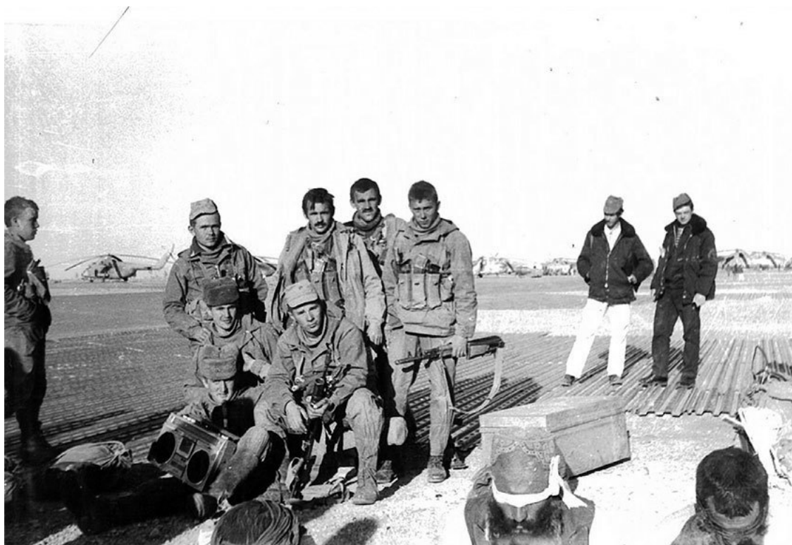
Кандагарский аэродром, стоянка вертолетного отряда, 205-го отдельной вертолетной эскадрильи, разведчики третьей роты вернулись из налета с пленными боевиками