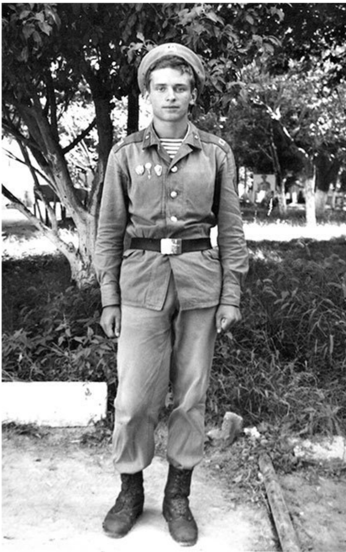
Командир отделения учебной роты минирования, 467-й отдельный учебный полк спецназа, г. Чирчик, май 1985 г.