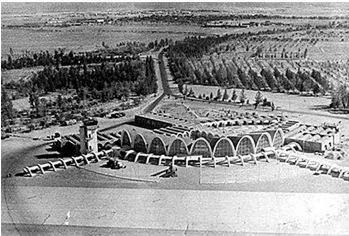
Кандагарский аэропорт Ариана

Я служил в роте минирования отряда и именно о своей роте, о ее становлении, о разной роли офицеров в этом процессе хочу рассказать.