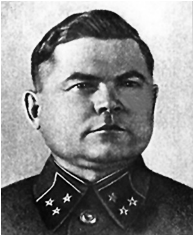
Н. Ф. Ватутин

После согласований, вечером 13 августа командующим