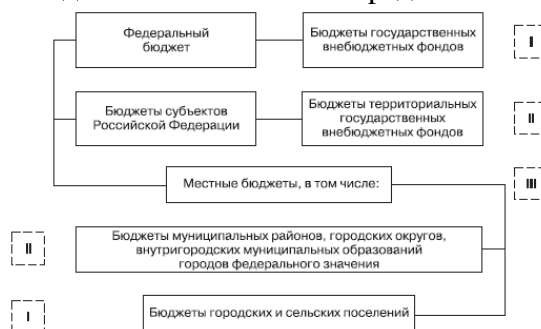
Рис. 2.1. Бюджетная система РФ

Бюджетная система РФ — это основанная на экономических отношениях и государственном устройстве РФ, регулируемая законодательством РФ совокупность федерального бюджета, бюджетов субъектов РФ, местных бюджетов и бюджетов государственных внебюджетных фондов. Структура бюджетной системы РФ представлена на рис. 2.1.