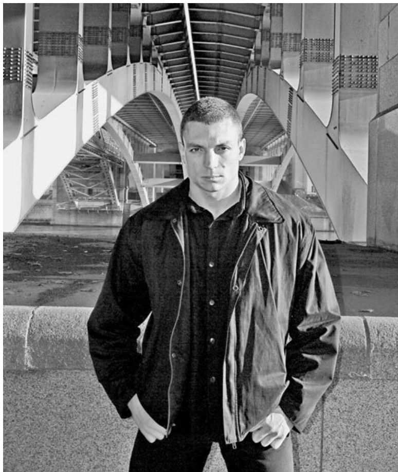
Фотография автора – Татьяна Либерман