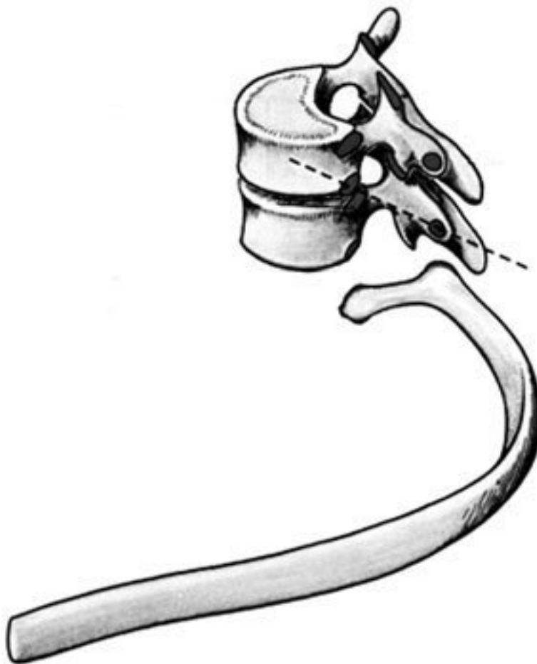
Рис. 2. Грудной позвонок

Величина тел грудных позвонков возрастает в нижнем направлении. Поверхности тел ровные. На боковых поверхностях тел, спереди от корня дуги, расположена суставная впадина для головки ребра. Поперечные отростки направлены в сторону и назад; их длина возрастает от I до IX грудного позвонков, затем уменьшается. На концах их поперечных отростков имеется суставная впадина для бугорка ребра (рис. 2).