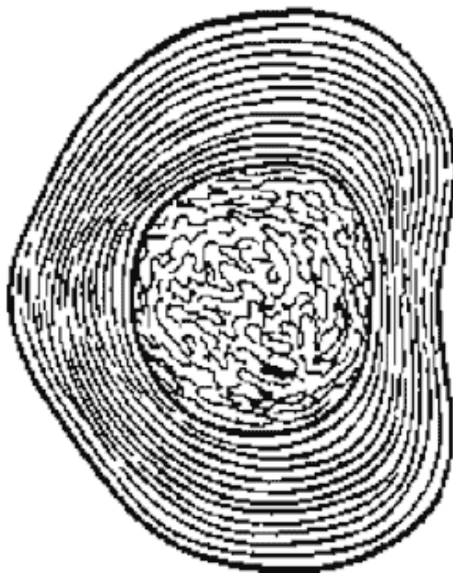
Рис. 4. Межпозвонокковый диск

Фиброзное кольцо межпозвоноккового диска состоит из концентрически расположенных волокнистых, отделенных друг от друга пластинок, уплотняющихся к периферии, а по мере приближения к центру переходящих в более развитый фиброзный хрящ, проникающий в студенистое ядро и объединяющий его с межклеточной стромой, в связи с чем четкой границы между фиброзным кольцом и студенистым ядром не наблюдается (рис. 4).