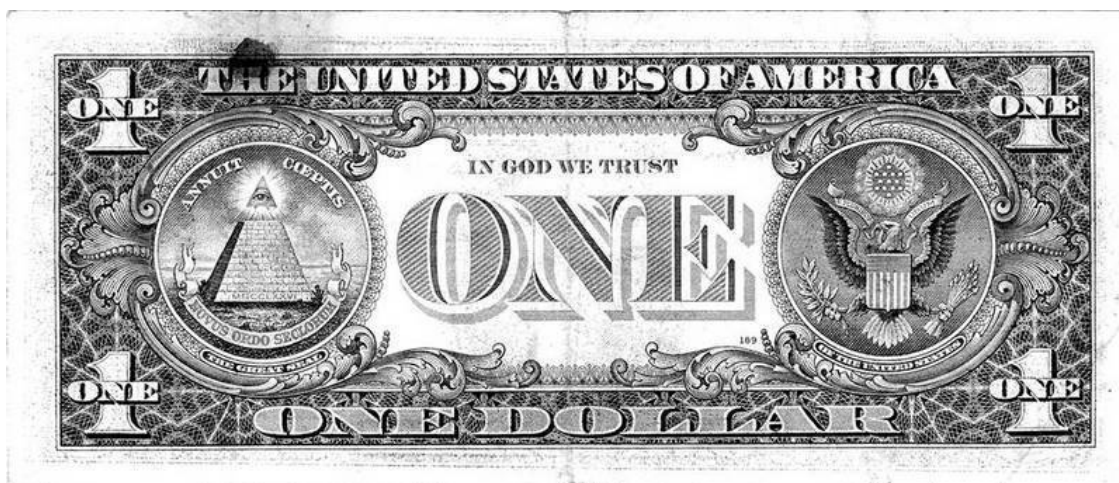
Рис. 1. Вот такая старая купюра может стать вашей неразменной купюрой – вашим талисманом. Важно найти ее.

«Я еще от своего отца слышал историю о счастливых деньгах. Он рассказывал, если в руки попадет бумажная купюра, на которой цифры серии будут соответствовать твоей дате рождения, и никогда ее не разменивать, то она принесет богатство и удачу. Все время, как помешанный, я пытался найти деньги со своим днем рождения. А как-то получил зарплату 500-рублевыми купюрами. Стал их пересчитывать и как обычно разглядывать. Своей даты рождения я на них не нашел, зато из первых букв серии на нескольких купюрах у меня сложилось слово «ЭТ-ОБ-ОГ-АТ-СТ-ВО» (Это богатство). Я сложил счастливые бумажки в коробочку и убрал ее в укромное место. «Неслучайно, они оказались у меня в руках. Это знак», – подумал я. С тех пор моя жизнь изменилась. Деньги потекли рекой. Меня повысили на работе до директора. Затем предложили заключить контракт с крупной иностранной фирмой. После поездки за границу я занялся расширением филиалов. Все складывалось как нельзя лучше. Фирма процветала и приносила хороший доход. Мы с женой купили новую машину, потом квартиру детям. В общем, катались как сыр в масле. Жена все удивлялась, почему ко мне деньги так и липнут. «Не к добру это», – причитала она. Но я твердо хранил свой секрет о счастливых купюрах. Как-то жена случайно обнаружила мой тайник и потратила одну из пятисоток. Вот тогда-то денежный поток и прервался. Как накаркала».