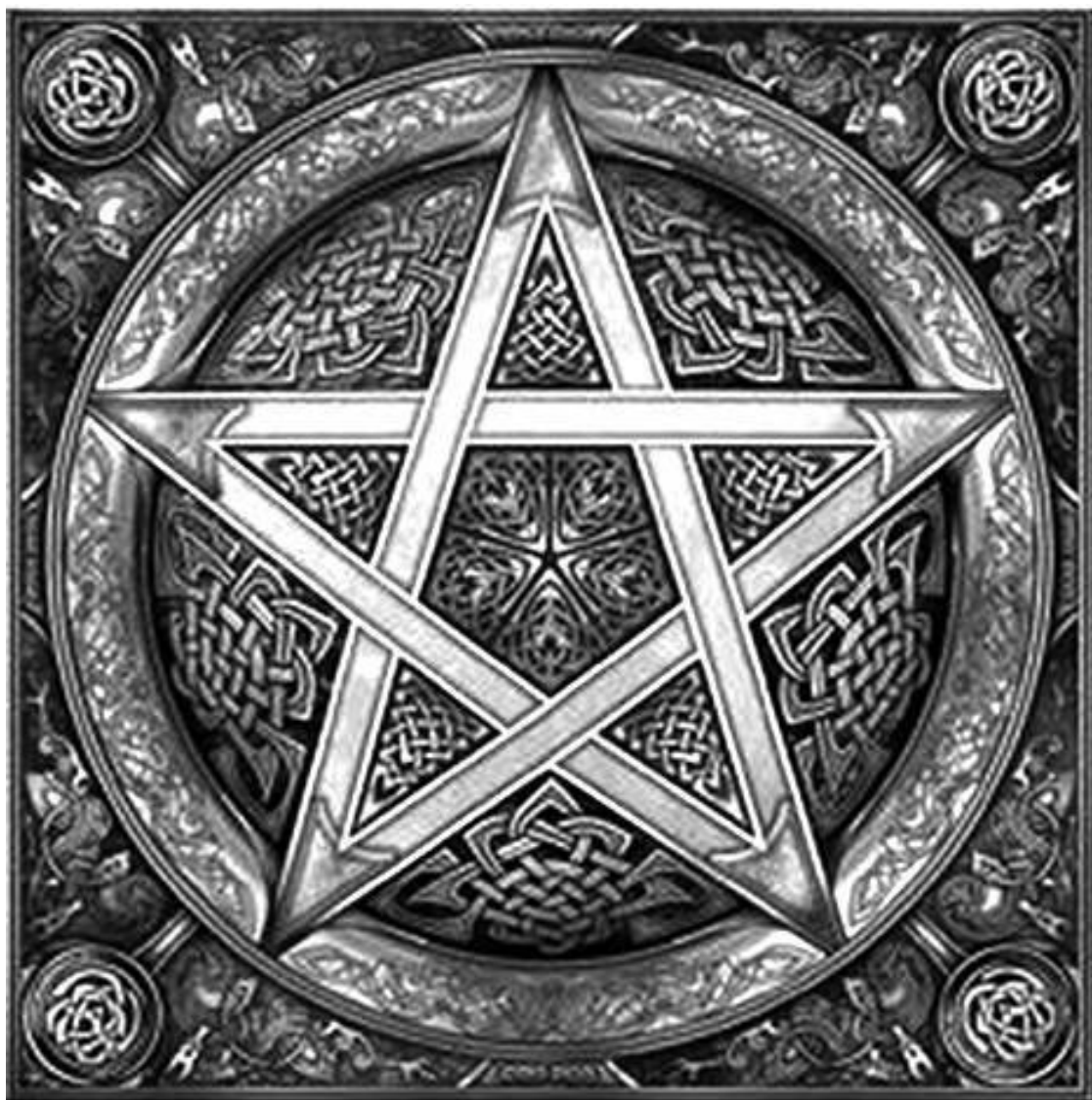
Рис. 3. Талисман-пентакль Соломона, чтобы заполучить власть и приумножить богатство