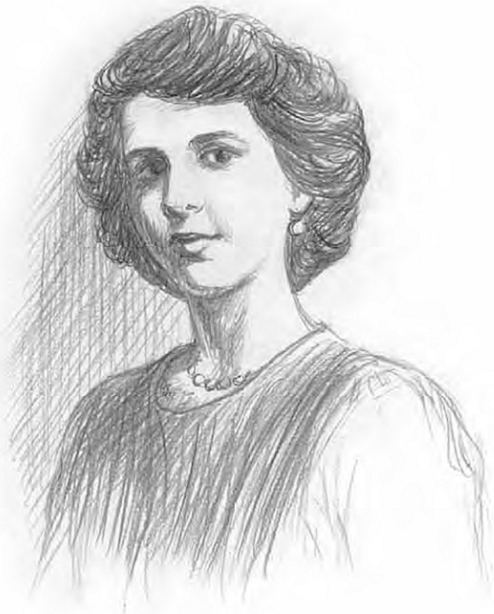
Лидия Чарская 1875 - 1937