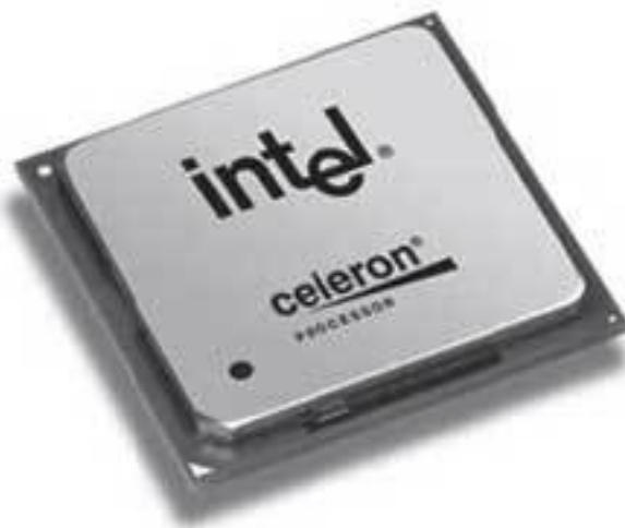
Рис. 1.2. Процессор Intel Celeron

Процессор (рис. 1.2,1.3) – двигатель компьютера. Его выбор определяет скорость вычислительных операций. Наиболее критичными по требованиям к процессору являются математические и статистические пакеты, мощные графические редакторы (например, 3ds Max), программы для обработки звуковой и видеоинформации, мультимедийные приложения и игры.