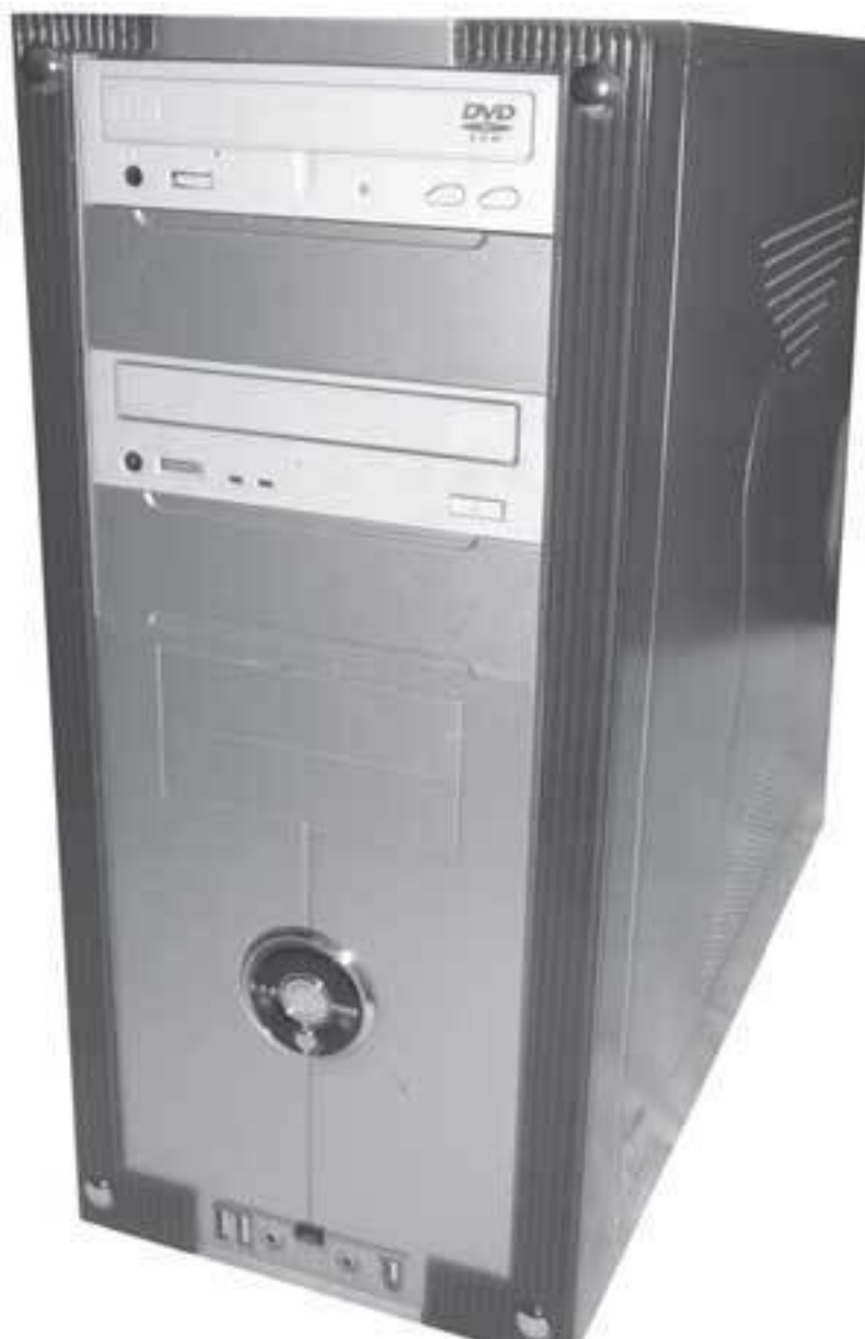
Рис. 1.1. Корпус ATX

После выбора модели корпуса необходимо задуматься о его типе и размере. По типу корпуса делятся на вертикальные и горизонтальные. Сейчас наиболее распространены вертикальные корпуса (типа «башня» (tower)), которые, в свою очередь, в зависимости от высоты бывают следующих разновидностей: