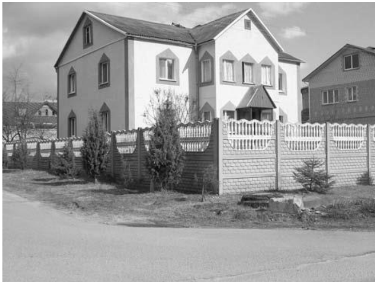
Рис. 1.3. Ограда из бетонных панелей