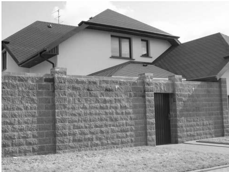
Рис. 1.1. Ограда из двойного облицовочного кирпича с фактурной поверхностью

Рядовой кирпич дешевле лицевого, однако поверхность его далека от декоративности. Кроме того, негладкость поверхности рядового кирпича требует защиты от воздействий окружающей среды, особенно от влаги (влага, скапливающаяся в неровностях, имеет обыкновение расширяться при замерзании – в точном соответствии с законами физики, что приводит к появлению на поверхности кирпича сначала микротрещин и других повреждений, а затем и к растрес-