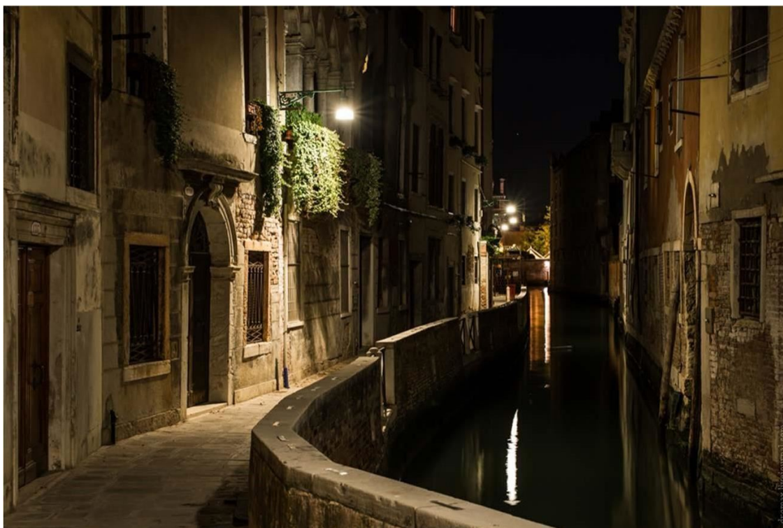
Улица в Венеции ночью

– Run! – опять властно сказал старик и, для убедительности, сделал жест рукой: иди, мол. Сергей, повинувшись этому жесту, пошел в темную глубину улицы. Прошел шагов десять и оглянулся.