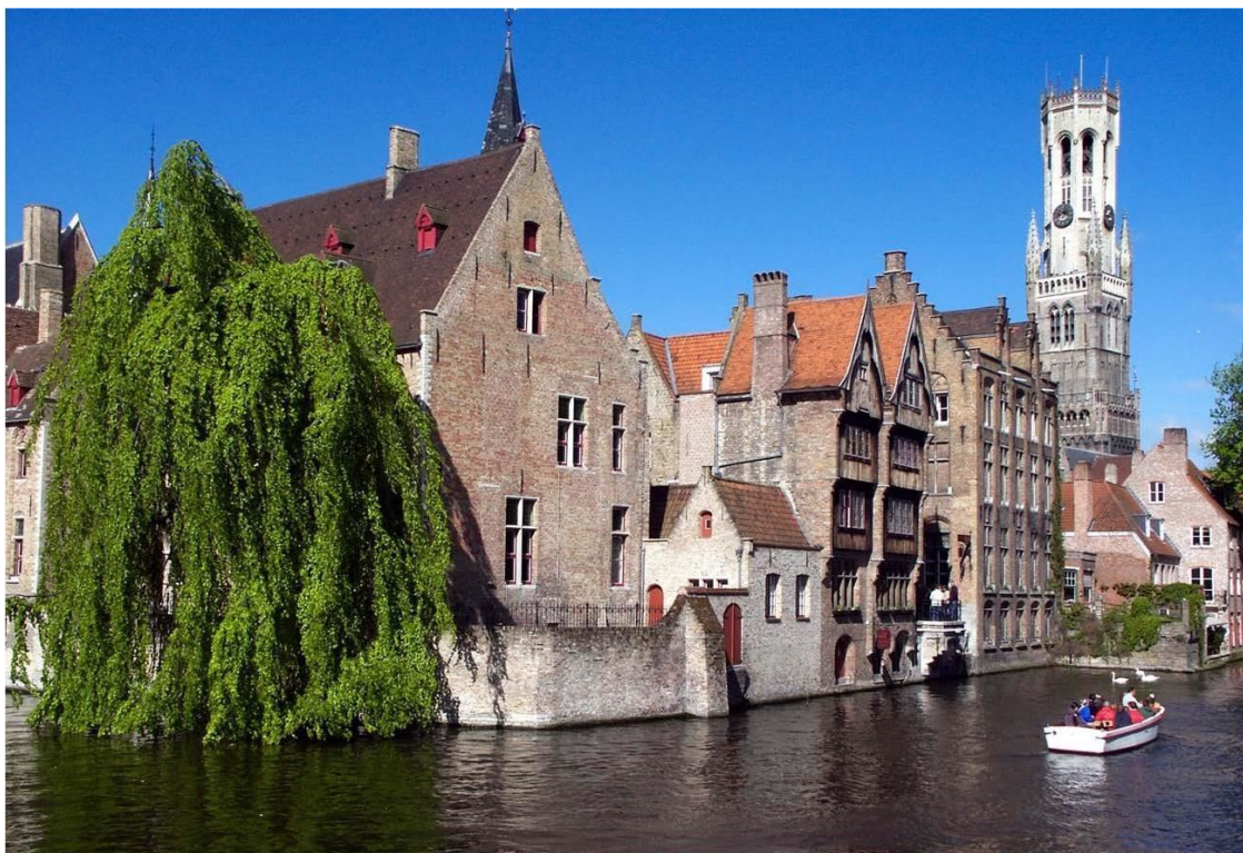
Брюгге, набережная Роз