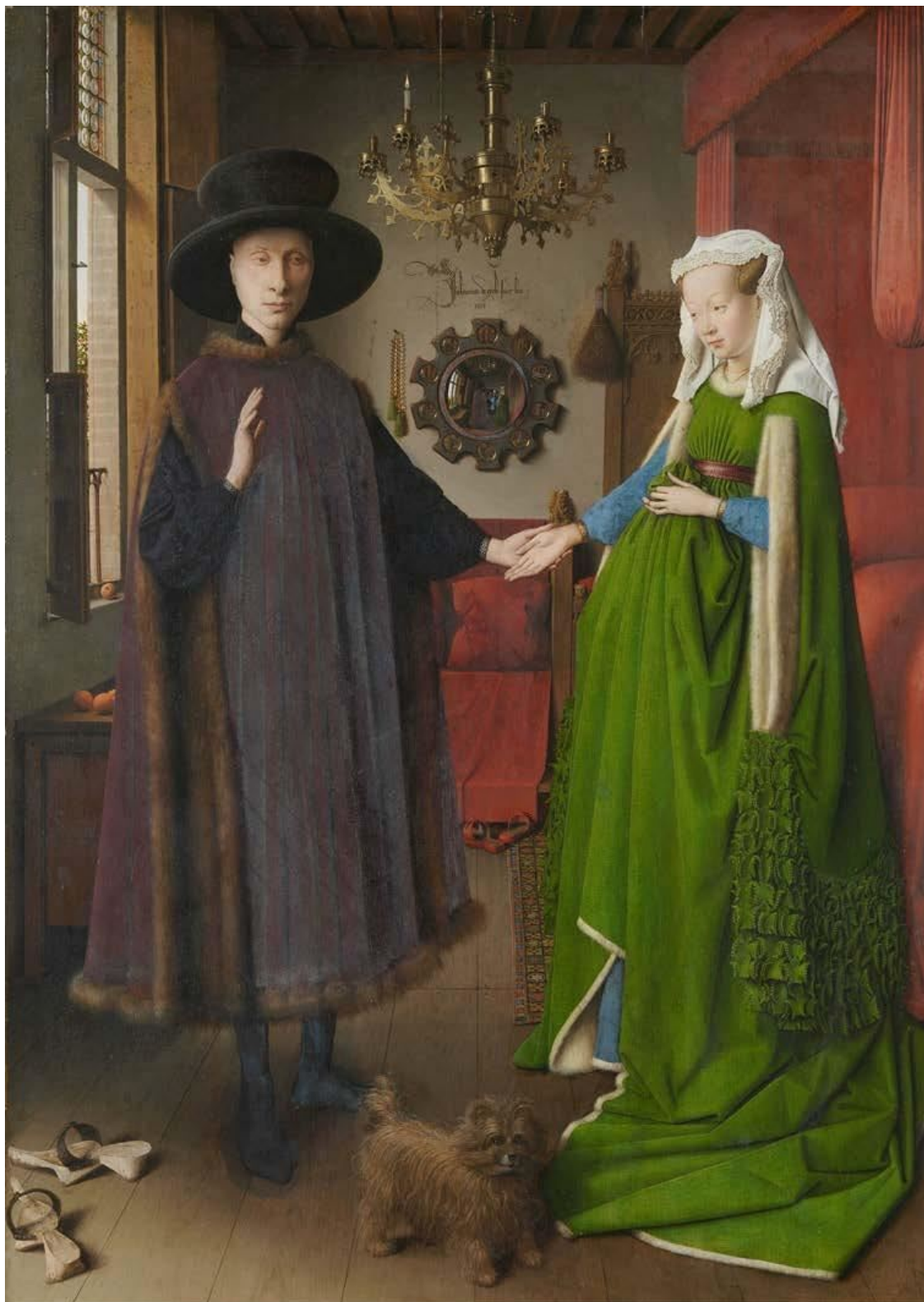
Ян ван Эйк, «Портрет семейства Арнольфини», 1434 год, Брюгге

Повисла пауза и подполковник Сиротин решил, что надо что-то ответить: