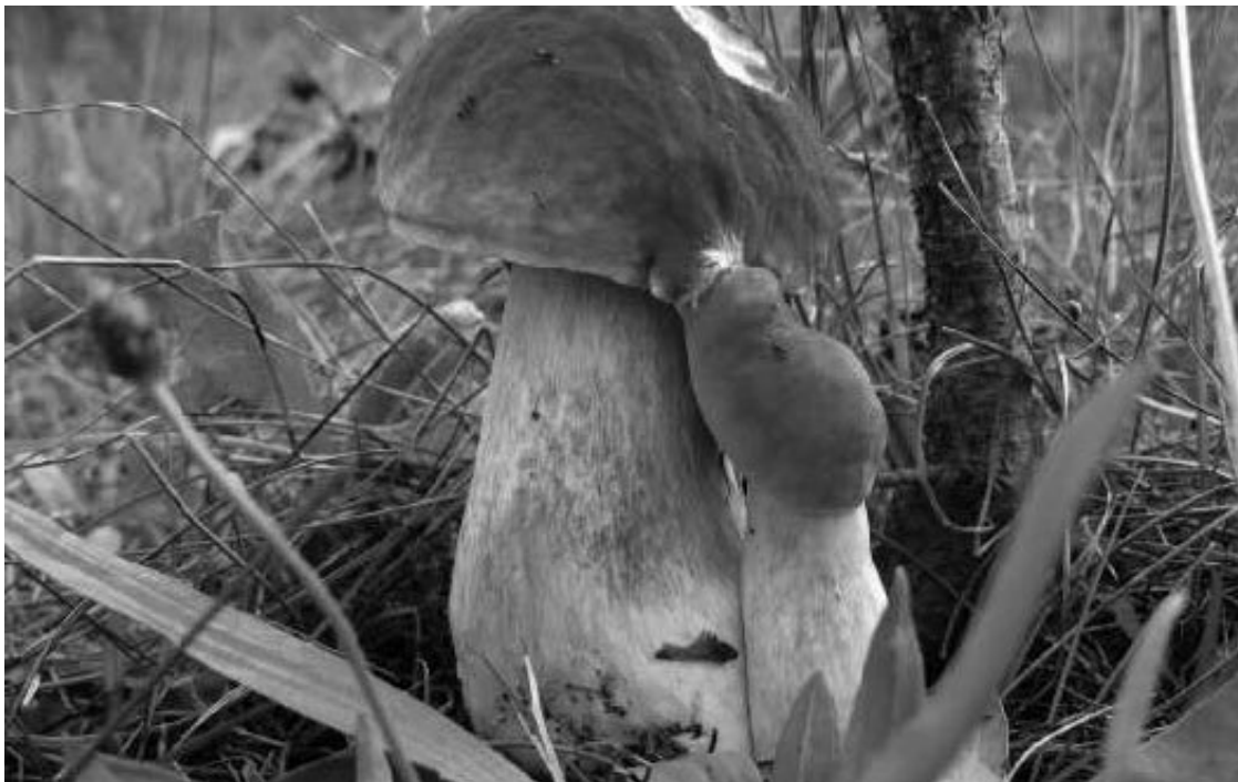
Рис. 1. Иногда боровики растут парами

Упражнение № 4. Предложите остроумную подпись к следующим картинкам (рис. 1, 2).