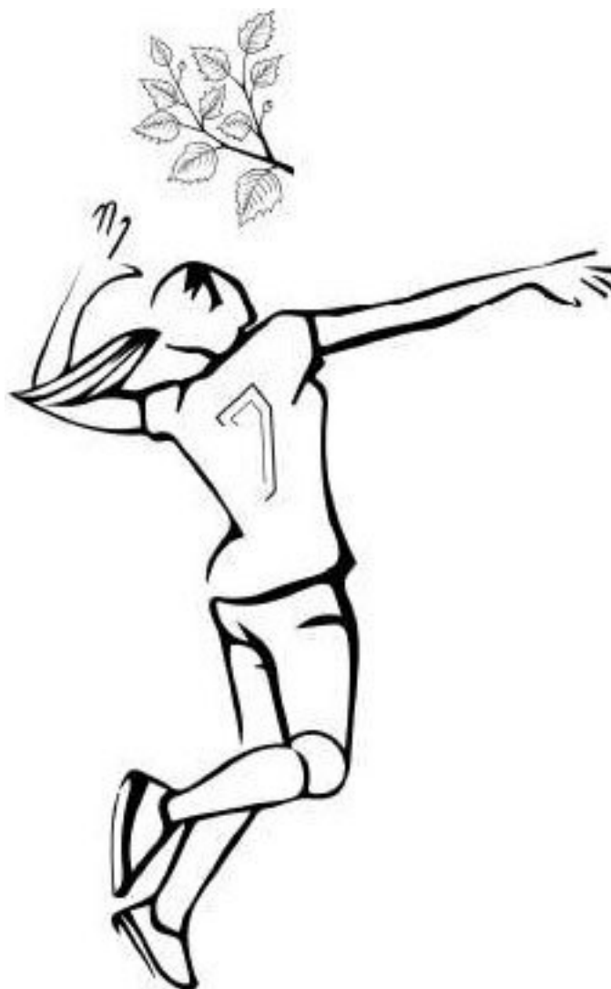
Рис. 2. Волейбол и листопад

Упражнение № 5. Справа – печенье, слева – финики. Совершите мысленное путешествие в прошлое и придумайте смешной заголовок к картинке (рис. 3).