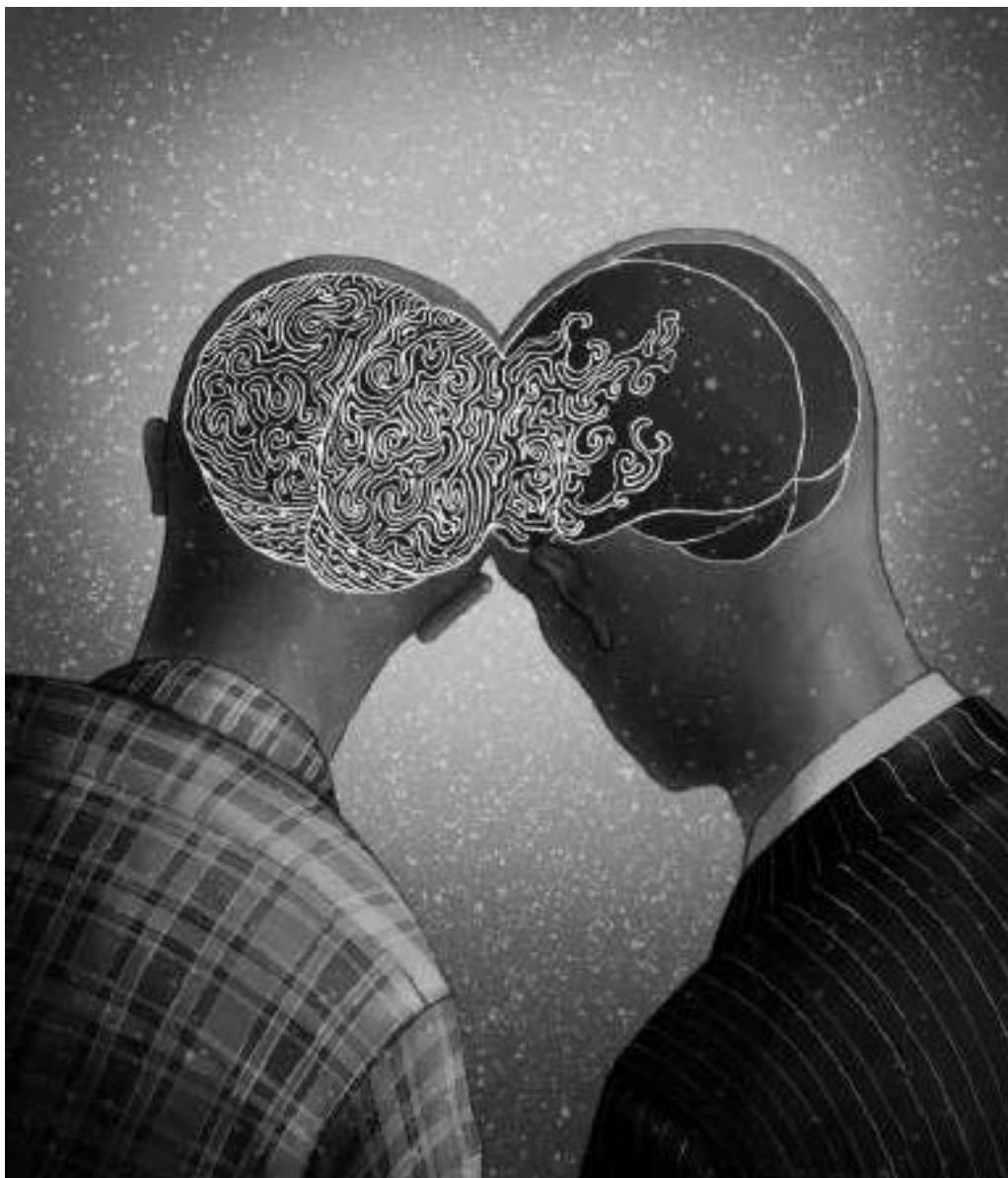
Рис. 1.2. Единомышленники думают друг о друга, взаимно щекочут мозги...

Смех читателя и связанное с ним удовольствие объясняются подсознательной гордостью за собственную способность мысленно восстановить это пропущенное звено. Именно поэтому шутки, которые надо объяснять, не смешны.