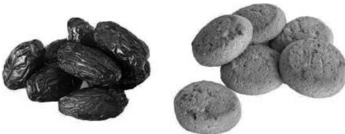
Рис. 3. Плоды пальмы и кондитерские изделия

Упражнение № 5. Справа – печенье, слева – финики. Совершите мысленное путешествие в прошлое и придумайте смешной заголовок к картинке (рис. 3).