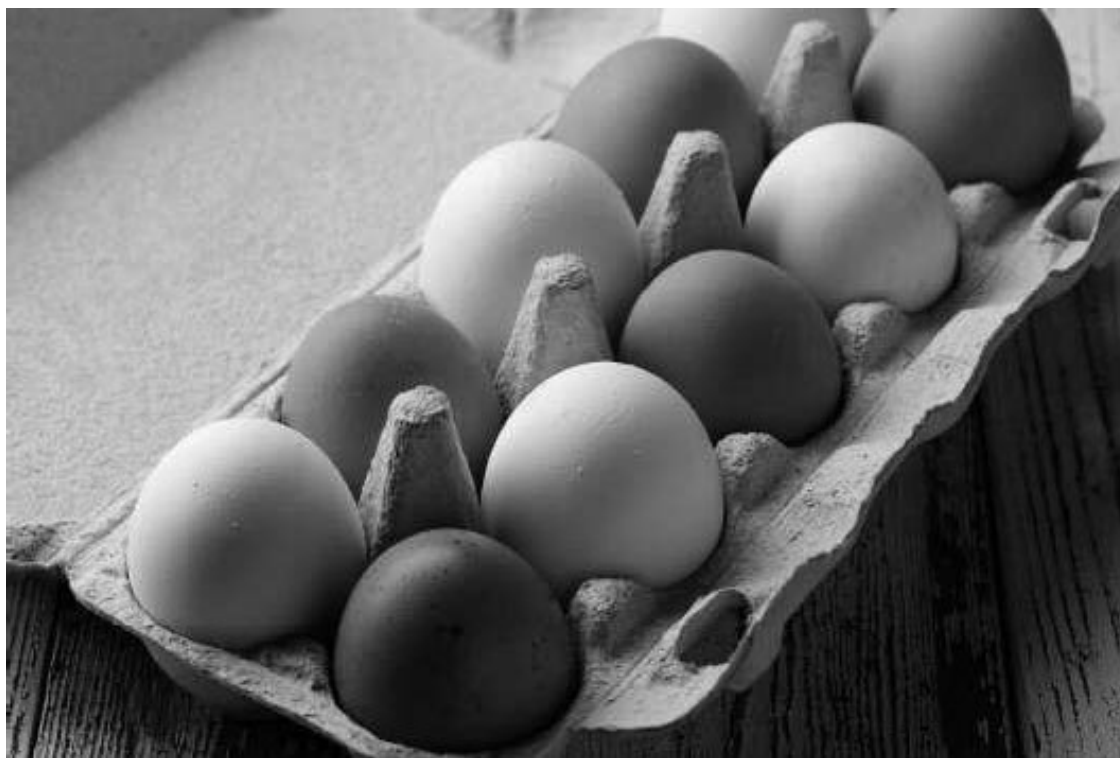
Рис. 1.3. Угадайте, кто из сотрудников уже побывал в отпуске

Вот теперь шутка готова. Разумеется, возможны и другие вариации (рис. 1.3).