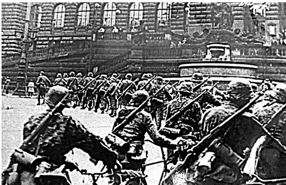
Прага 5 мая 1945. Веловзвод Ваффен-СС с полной боевой выкладкой и в полевой форме проходит у здания Государственного музея.

«...пятого мая в полдень обедаем и слушаем радио. Вдруг прямо из приемника раздается отчаянный крик: «Алло!.. Алло!.. Вызываем полицию, жандармерию, правительственные войска на помощь Чешскому радио!.. Эсэсовцы нас тут убивают!..»