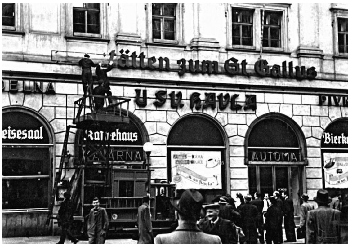
Прага 4 мая вторая половина дня или 5 мая рано утром, ул. Рытиржска. Муниципальные служащие снимают с фасада здания немецкие надписи, хотя в этом случае это просто название ресторана с пивной.