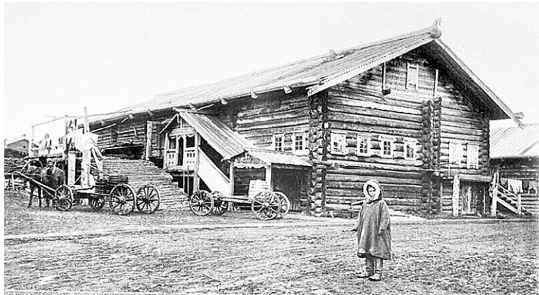
Дом на Русском Севере