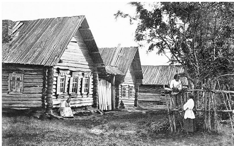
Вид деревенской улицы в Ярославской губернии. 1871–1878 гг.

Большим своеобразием отличались так называемые курени донских казаков. Это были высокие двухэтажные, квадратные в плане здания под тесовой четырехскатной крышей. Хлев, конюшня, овчарня, птичник и другие постройки находились на некотором расстоянии от жилого дома.