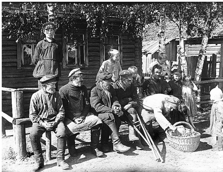
Группа мужчин и детей у дома. Ленинградская обл., Тосненский р-он, г. Никольское. 1925 г.

Совсем непохожа на казачье жилище усадьба русского крестьянина Сибири и Алтая. Это своего рода крепость: высокая бревенчатая изба, амбар, расположенный на некотором от нее расстоянии, забор с массивными воротами, глухой двор, по периметру которого устроены помещения для скота, погреб, сеновал, навес для дров.