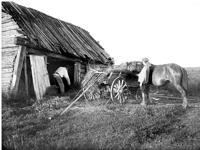
Уборка сена в сарай. Ленинградская обл., Тосненский р-он, город Никольское. 1925 г.

пили каждую субботу. В первый жар-пар ходил дед с внуком. Мытье с дедом было сплошным кошмаром, т. к. он проделывал такую экзекуцию при парке, что черти не выдержали бы этого жару и разбежались. Дед драл себя веником. На голове у него – меховая шапка, а на руках – рукавицы. А кряхтения и пыхтения – и того больше. Затем катание в снегу. Дед повторял это до трех раз. Далее обливался холодной водой, надевал одни подштанники и бежал домой...» [49]