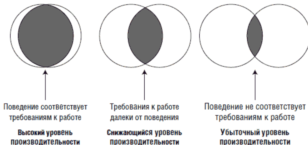
Рис. 1.2. Изменение требований к поведению

Подумайте о работе, которую вы выполняете сейчас, и о той, которую вы выполняли 12 месяцев назад. Подумайте, что осталось без изменения, а что изменилось. Список того, что изменилось, – именно что-то новое, что вы делаете для выполнения работы, – удивит вас. Если вы думаете, что сейчас выполняете работу самым эффективным способом и лучше уже не сделаете, вы, очевидно, уже замедлили темп и начали отставать.