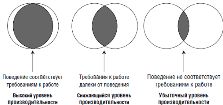
Рис. 1.2. Изменение требований к поведению

Подумайте о работе, которую вы выполняете сейчас, и о той, которую вы выполняли 12 месяцев назад. Подумайте, что осталось без изменения, а что изменилось. Список того, что изменилось, – именно что-то новое, что вы делаете для выполнения работы, – удивит вас. Если вы думаете, что сейчас выполняете работу самым эффективным способом и лучше уже не сделаете, вы, очевидно, уже замедлили темп и начали отставать.