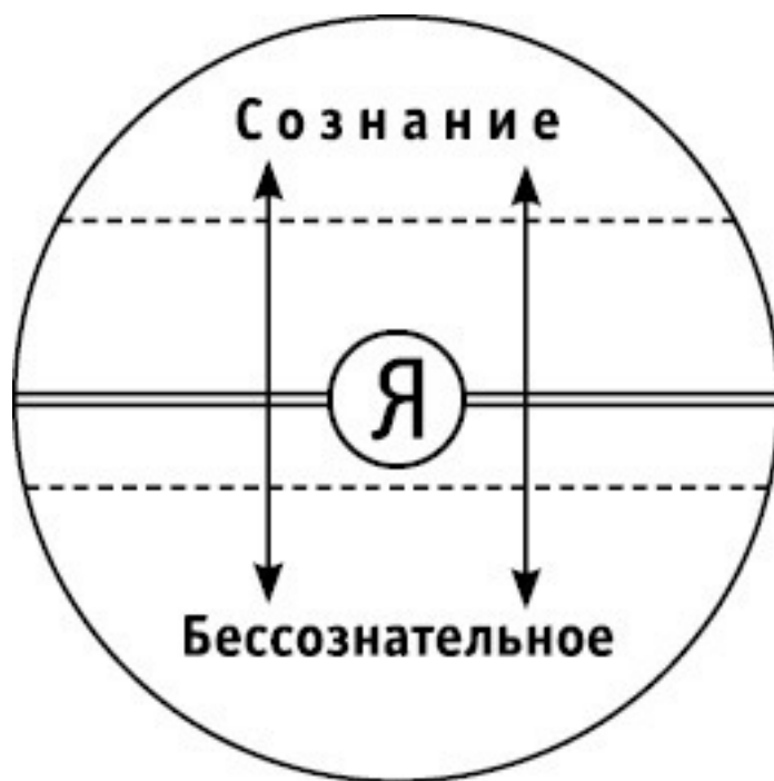
Схема 1. Сознание и бессознательное по Юнгу

Линия, разделяющая эти две области в рамках нашего «Я», может быть сдвинута в обоих направлениях – что показывают стрелки и пунктирные линии на рисунке. Конечно, положение «Я» в самом центре круга следует воспринимать как условность. Смещение разделительной линии вверх означает ограничение сознания, а вниз – его расширение.