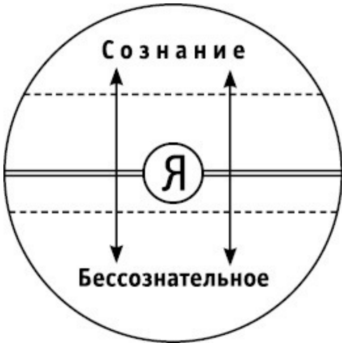
Схема 1. Сознание и бессознательное по Юнгу

Линия, разделяющая эти две области в рамках нашего «Я», может быть сдвинута в обоих направлениях – что показывают стрелки и пунктирные линии на рисунке. Конечно, положение «Я» в самом центре круга следует воспринимать как условность. Смещение разделительной линии вверх означает ограничение сознания, а вниз – его расширение.