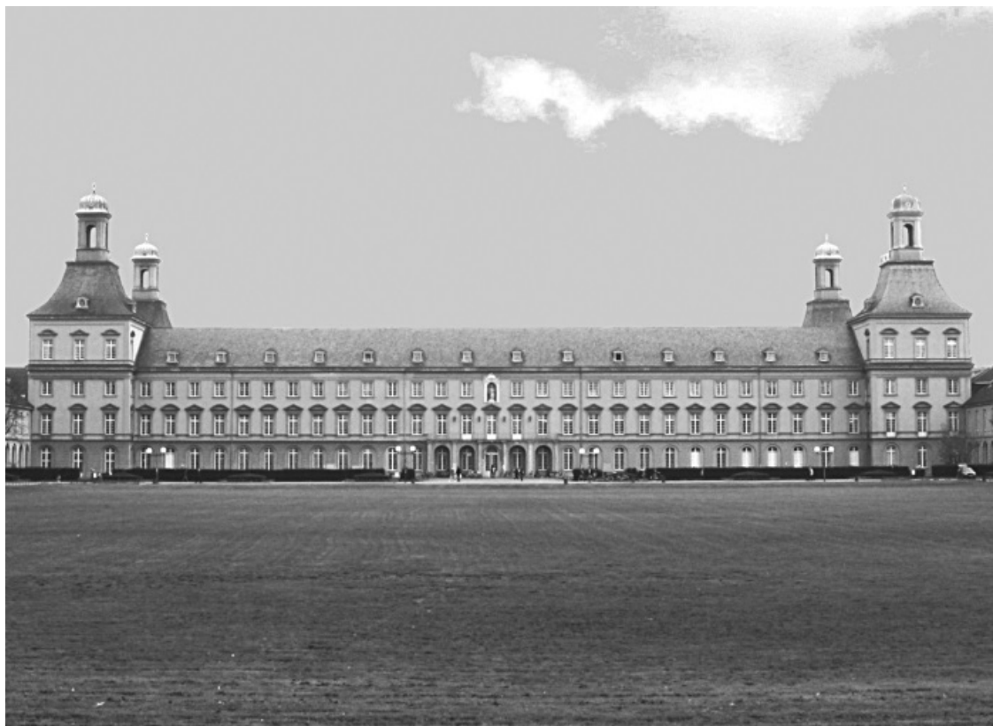
Боннский университет, где учился Ницше