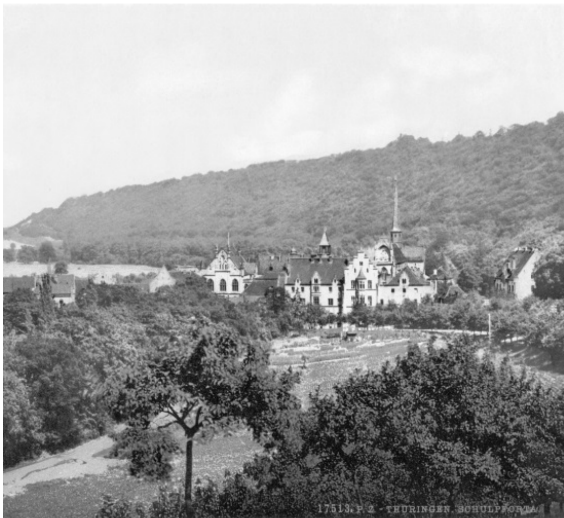
Школа Пфорта, куда в 1858 году поступил Ницше (фото ок. 1900 г.)