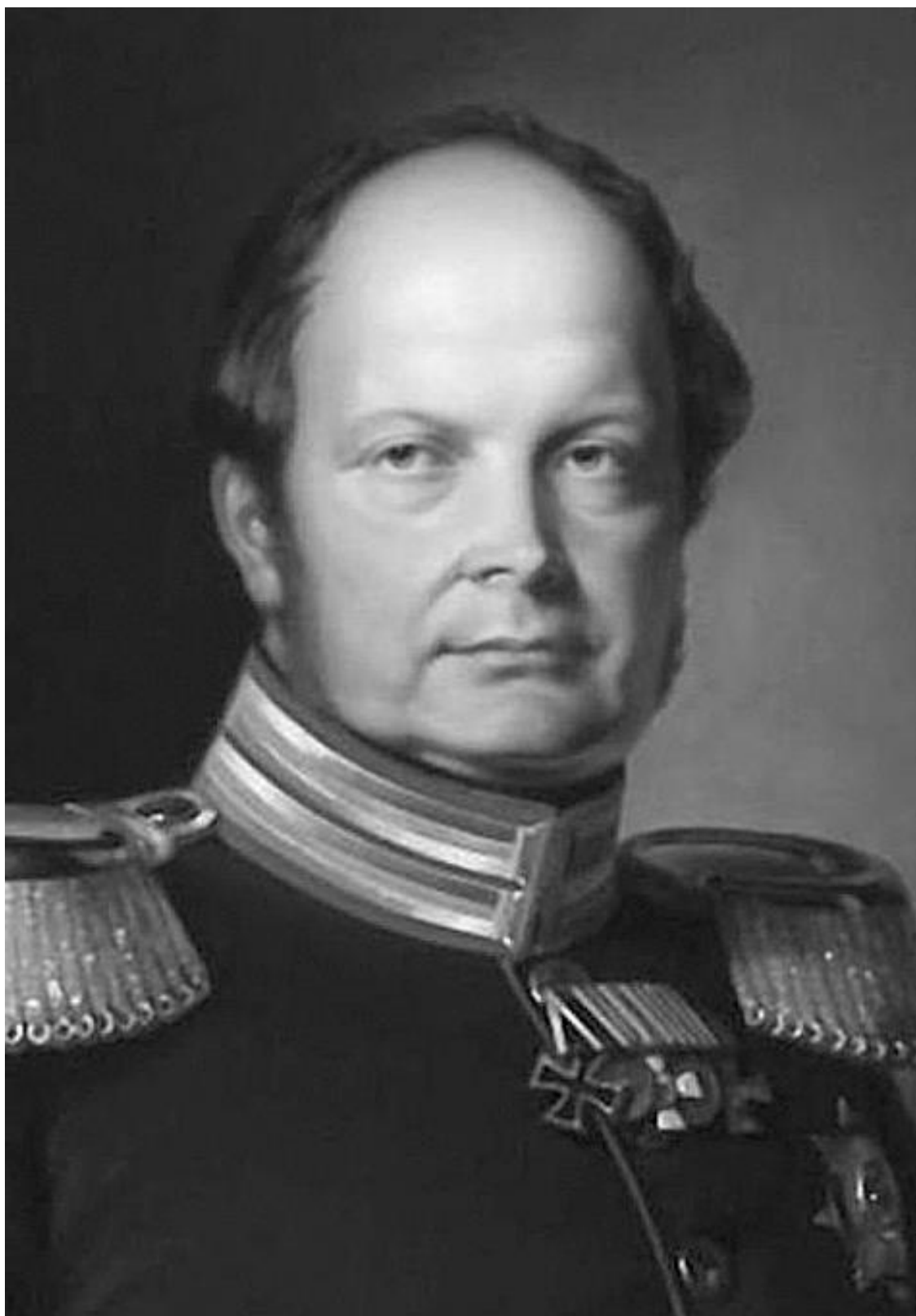
Фридрих Вильгельм IV Гогенцоллерн (1795–1861) – прусский король (с 7 июня 1840 г.), последний немецкий доимперский монарх

Маленький Фриц Ницше окружен религиозной атмосферой: отец – священник, мать – из семьи священника. Они живут в доме, принадлежащем церкви. Впоследствии это даст повод одним биографам узреть в таком положении истоки «нигилистических» взглядов Ницше,