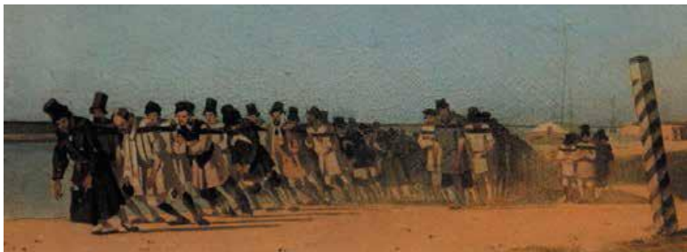
В. Верещагин. «Бурлаки». Этюд. Х.м. 1866

смейем заметить, что им известны и менее привлекательные, а порой просто ужасные моменты из того же недавнего прошлого шекснинского судоходства.