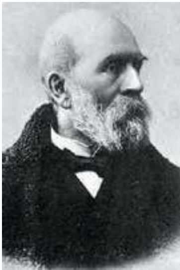
И. А. Милютин (1829–1907)

Третьего июля 1905 года Милютин направляет ему телеграмму: