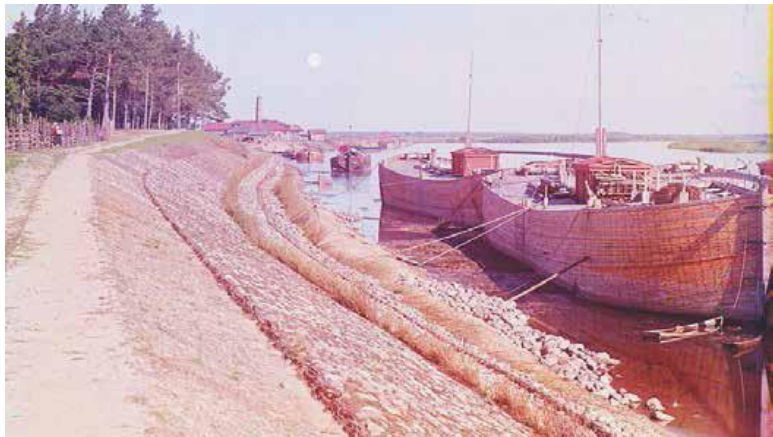
Шексна у деревни Вахново.

Центр села Городище украшали две церкви: Знамения Пресвятыя Богородицы – холодная о 5-ти главах со слюдяными окончинами (1731 г.) и теплая – великомученицы Параскевы об одной главе, построенная Бестужевым-Рюминым в 1733 году. Позднее тщанием прихожан на месте этих церквей поставлены были две каменные: одна 2-х этажная в честь Святой и Живоначальной Троицы с теплым приделом в честь святой великомученицы Параскевы (1796 г.), а другая в честь Знамения Пресвятой Богородицы и преподобного Александра Свирского, чудотворца (1820 г.).