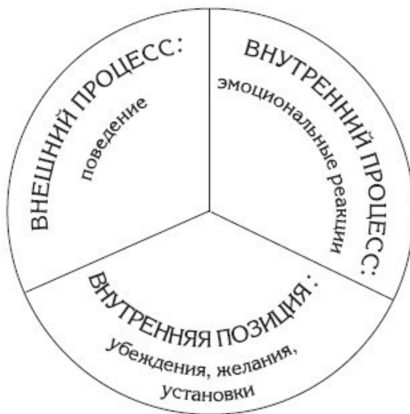
Рис. 1. Символическое изображение психологических структур, определяющих жизнедеятельность человека

И вот здесь разрешите вас порадовать: при рождении каждый из нас получает в свое распоряжение «мерседес». И это не яркая метафора для повышения вашей самооценки. Не ищите здесь иронии или желания сделать вам дежурный комплимент: взгляните на рис. 1, и суть этой фразы станет вам понятной.