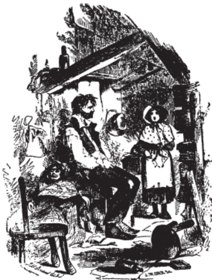
Сцена в Старой пивоварне