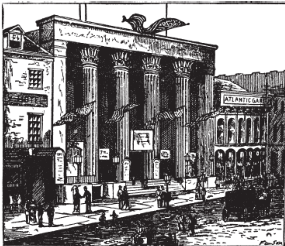
Старый Театр Бауэри