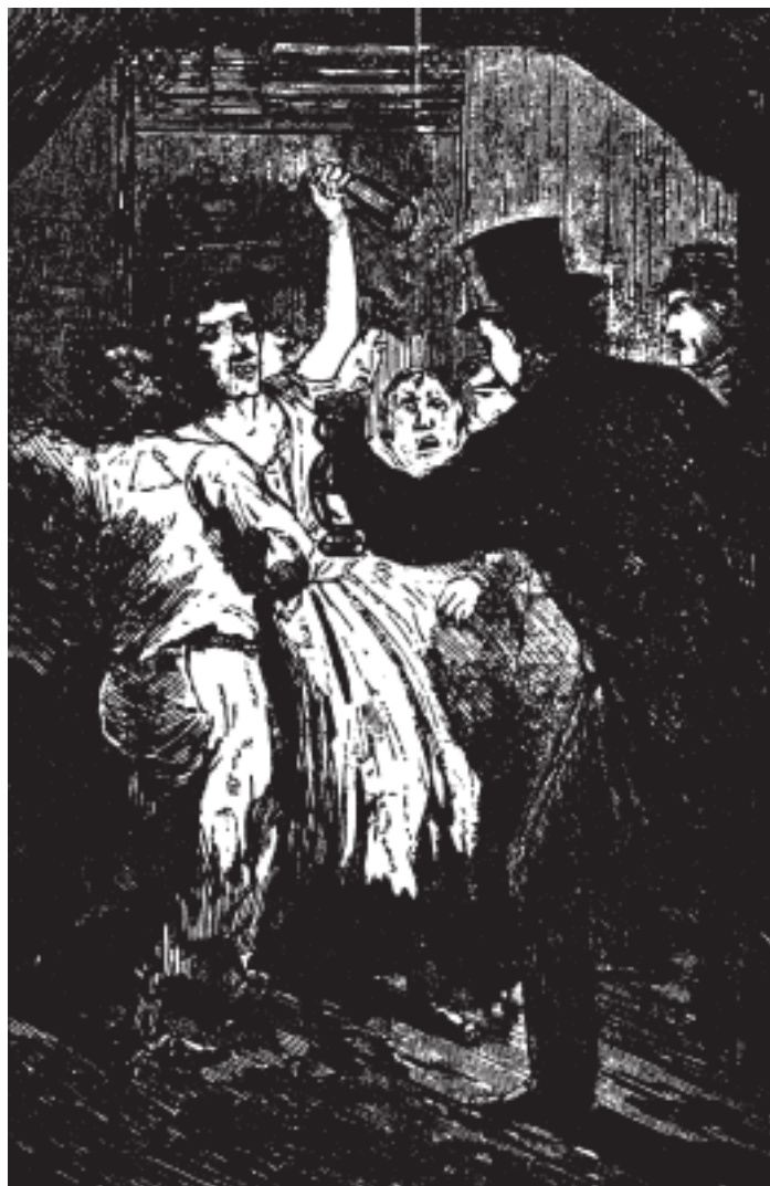
Кабак в Пяти Точках

Откройте дверь одной из этих тесных хибар, полных спящих негров. Ба! Внутри горит огонь, пахнет горячей одеждой или мясом, так близко они собрались вокруг жаровни; и везде угарный туман, который ослепляет и душит. Из каждого угла, в который вы заглянете на этих темных улицах, ползет в полусне какая-то фигура, и кажется, что наступает время Страшного суда и темные могилы исторгают своих мертвецов. Тогда собаки воют и принуждают мужчин, женщин и детей покидать ночлег, заставляя испуганных крыс убежать в поисках лучших мест. Здесь также есть дорожки и аллеи, вымощенные грязью по колено; подземные комнаты служат здесь для танцев и игр; стены здесь украшены грубыми рисунками кораблей, фортов, флагов и бесчисленными американскими орлами; разрушенные дома, открытые настежь, где через огромные дыры в стенах вырисовываются очертания других развалин, как будто этому миру порока и нищеты больше нечего показать; огромные многоквартирные дома, которые названы по именам грабителей и убийц; все это отвратительно, уныло, и везде разруха».