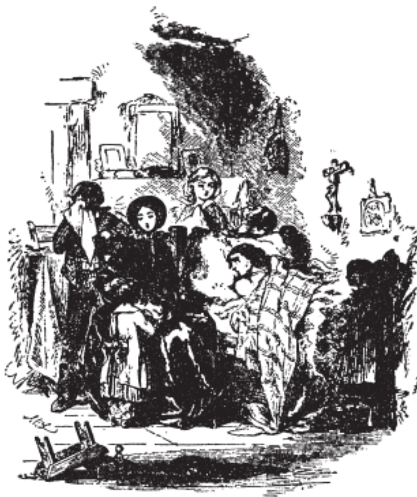
Умиравшая мать – сцена в Старой пивоварне