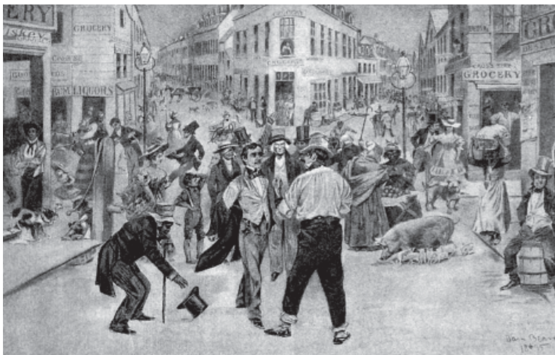
Встреча между «щеголем» и «парнем Бауэри». Пять Точек в 1827 году

Известно, что банда, получившая название «сорок воров», про которую можно сказать, что это была первая банда Нью-Йорка с определенным, известным руководством, формировалась в зеленой лавке Розанны Пирс, задняя комната которой использовалась ими для собраний и служила штабом Эдварду Солеману и другим известным главарям. Здесь они получали донесения от своих прислужников, и из этих тускло освещенных углов гангстеры отправлялись на свои военные вылазки. «Керрионцы», в основном выходцы из ирландского графства Керри, тоже родились в стенах лавочки Розанны. Это была небольшая банда, которая шляется по Центральной улице и устраивала изредка драки; ее члены посвящали себя в основном культивированию ненависти к англичанам.