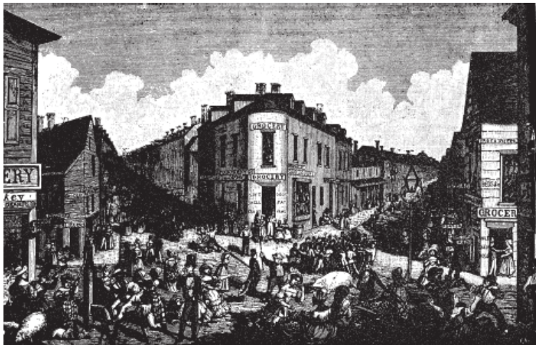
Район Пять Точек в 1829 году

История банд Нью-Йорка, изложенная Гербертом Осбери в 1928 году в его солидной книге на четырех сотнях страниц, раскрывает всю мерзость варварского мироздания, его огромные размеры, царившие в нем беспорядок и жестокость. Действие в книге происходит в подвалах старых пивоварен, превратившихся в бараки негров и нищих ирландцев, в выдавшем виды трехэтажном Нью-Йорке, заполненном бандами негодяев вроде «болотных ангелов», которые выбираются из канализации на мародерские вылазки; головорезов типа «рассветных», вербующих в свои ряды 10 – 11-летних убийц; лишенных совести громил-одиночек вроде