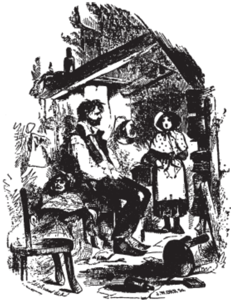
Сцена в Старой пивоварне