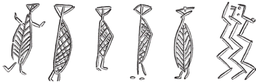
Рис. 4. Фигурки, вырезанные на кости из Рюемаркгорда, о. Зеландия, Дания. Высота – около 2,6 см. Хранятся в Национальном музее Копенгагена

В Сольсеме, в пещере, были обнаружены встречающиеся довольно редко изображения танцующих фаллических фигур, а также кости животных и людей, приспособления для рыбной ловли и охоты. Все это свидетельствует о том, что это место вполне могло быть святилищем. Однако вполне возможно, что эти рисунки были сделаны земледельцами, а не охотниками. Священные изображения северных охотников всегда располагались на открытом воздухе, недалеко от воды, а не в закрытых святилищах, специально предназначенных для отправления религиозных ритуалов.