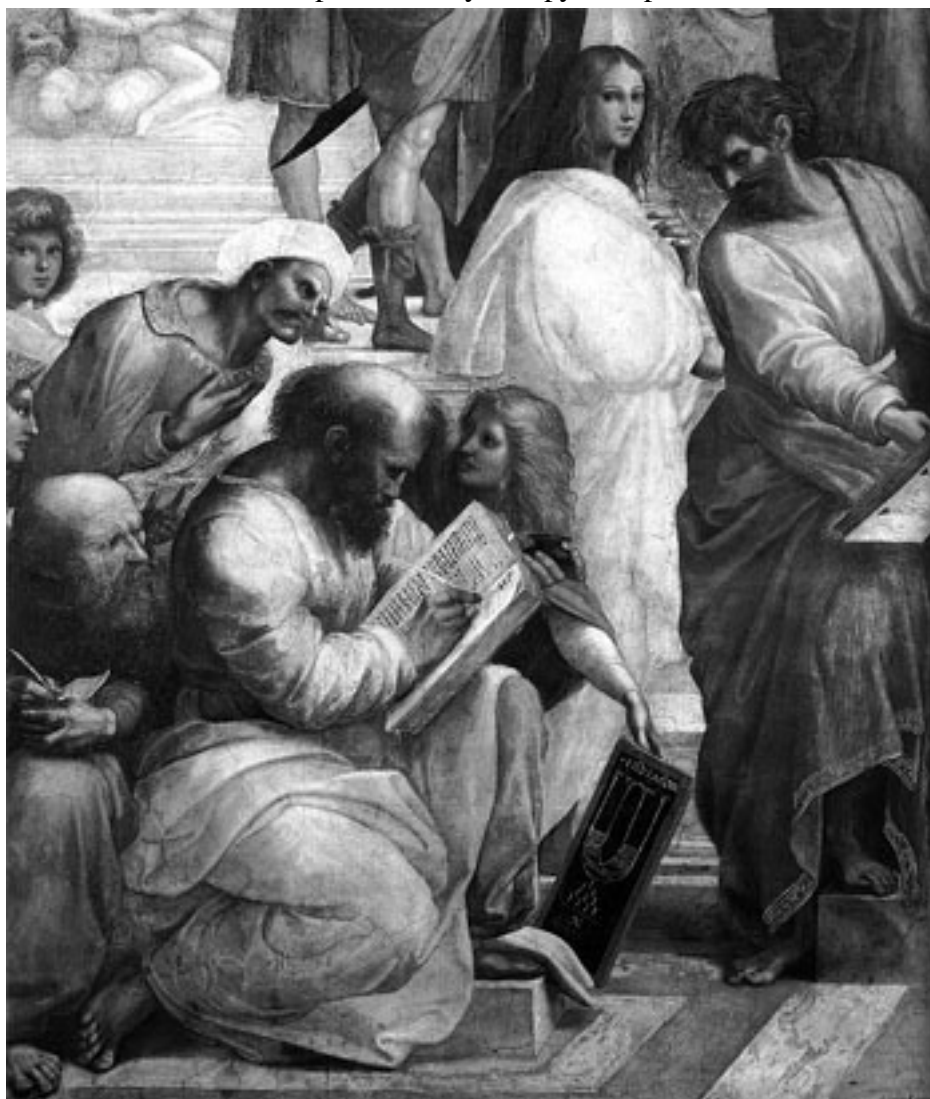
Пифагор на фреске Рафаэля Санти. 1509

Судьба величайшего древнегреческого математика и философа Пифагора (540–500 до н. э.) связана со множеством мифов и мистических преданий. Сведения о его биографии крайне противоречивы, тем более что многочисленные ученики его школы, создавшие после смерти учителя пифагорейское общество, и сами сочинили многие легенды. Но одно предание, передававшееся из уст в уста на протяжении веков, никогда не подвергалось сомнениям. Оно рассказывало о самом главном – рождении великого математика – и раскрывало тайну его имени. И в самом деле: почему родители назвали сына в честь древнего змея – Пифона? Но оказалось, что имя было дано новорожденному по другой причине.