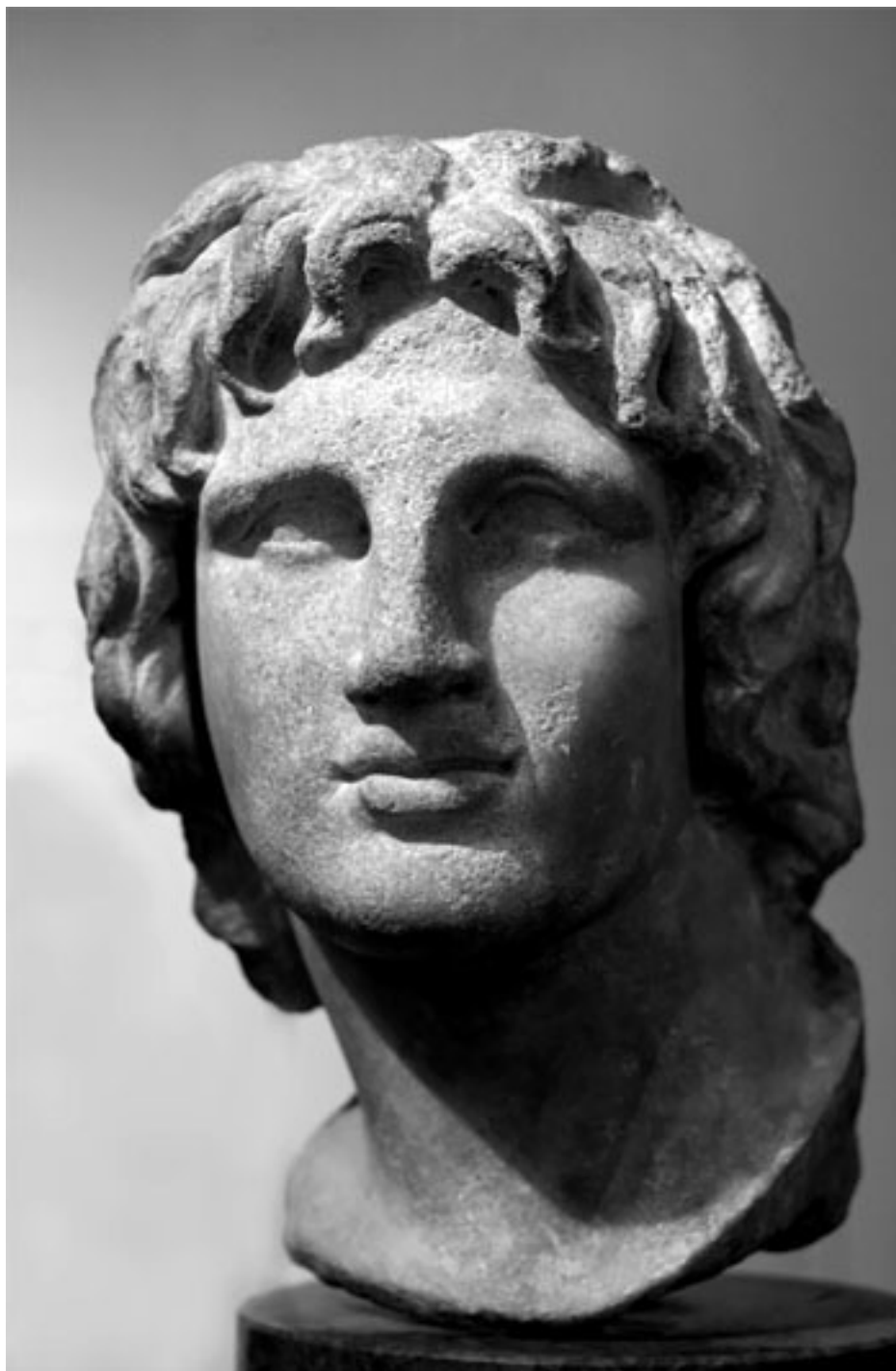
Бюст Александра Македонского. II–I век до н. э.

Увы, Филипп не смог в полной мере погордиться воспитанием своего великого сына: в 336 году до н. э., когда Александру было всего 20 лет, его отца заколол кинжалом один из недругов. Подобного конца ничто не предвещало: Филипп был любим подданными, власть его прочна, он уже был провозглашен главным вождем всех эллинов в войне против Персии. Однако незадолго до случившегося злодеяния Филипп посетил Дельфийский оракул, и пифия предсказала: