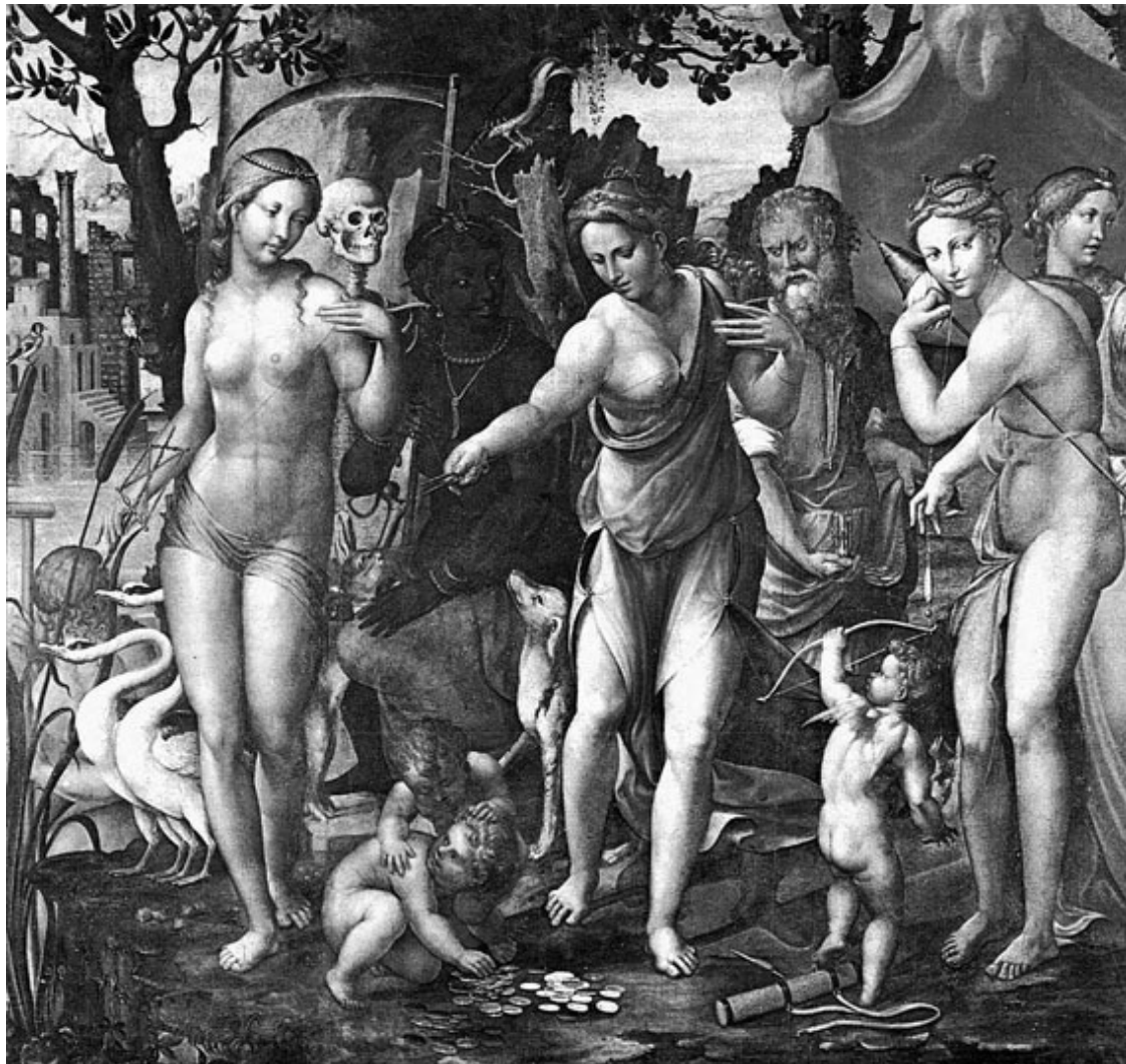
Иль Содома. Три мойры. Ок. 1525

Будущее всегда манило человечество, однако также всегда и пугало. Неизвестно, что там – за горизонтом сегодняшнего дня. Недаром же мудрый библейский царь Соломон говорил: «Умножающий знание – умножает печаль». Ну а античные философы были уверены, что «завеса будущего – самый лучший дар судьбы». И стоит подчеркнуть: предсказание судеб – особый дар, которым не обладают даже великие боги.