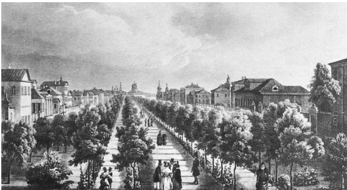
Тверской бульвар в 1825 г.

Бульвар был освещен. Но свет горел как-то тускло, фонари рассыпались искрами в сухом воздухе и терялись где-то в вышине. Листья уже облетели, и остовы деревьев торчали неустроенно, некрасиво, коряво. На душе стало тревожно. И почему я не поехала на метро? На бульваре не было ни души. Вот странность! Ведь москвичи гуляют здесь в любое время суток и в любую погоду. Так повелось аж с конца XVII века, когда бульвар засадили деревьями и он сразу стал любимым и самым уютным местом Москвы. Его украсили беседками, фонтанчиками, резными мосточками, даже бюсты знаменитых людей поставили. Тут прогуливалась вся аристократическая Москва. А по бокам неспешно ездили кареты, из которых выглядывали юные красотки, прельщая кавалеров. Часто кареты создавали такое столпотворение, что и проехать невозможно.