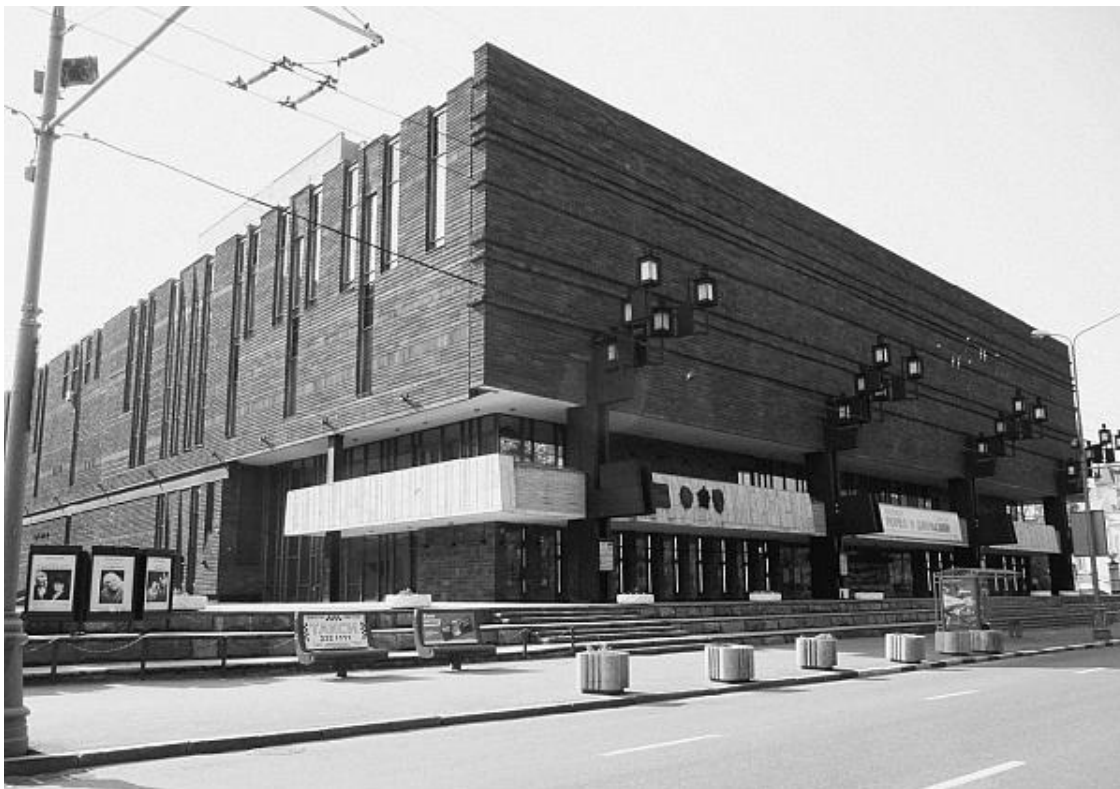
Здание МХАТа им. Горького

Наш великий вождь народов однажды, вытряхнув своей иссохшей рукой табак из знаменитой трубки, решил, что и бедного Михоэлса пора вытряхнуть из жизни – слишком уж велики стали его влияние и известность в стране и мире. Словом, в 1948 году Соломон Михоэлс разбился на машине где-то под Минском. Похороны в Москве были наипышнейшими. Только народ все равно шептался: великого актера убрали по приказу сверху.