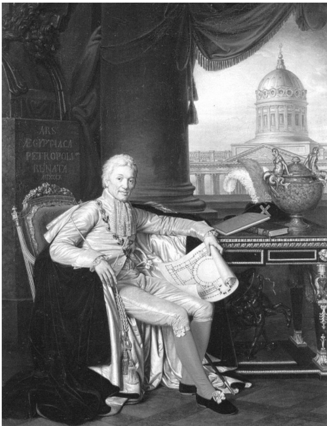
А.Г. Варнек. Портрет А.С. Строганова

Граф оказался в партии императрицы, а Анна Михайловна разделила позицию своей семьи. В 1764 году графиня Строганова возвращается к родителям и теперь представляет себя как «Воронцова, бывшая по несчастью Строгановой» 32 [1].