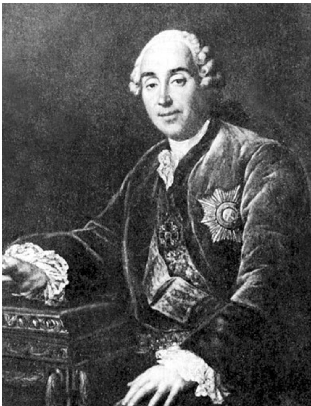
Ф.Г. Друэ-младший. Портрет Д.М. Голицына

После кончины императора отец С.Р. Воронцова Роман Илларионович был арестован. У него отняли имения в Малороссии – Белики, Кобыляки, Старые и Новые Сенжары, лишили также имения в Карелии. Он «вынужден был продать железные руды, которые составляли половину его имения <...>», [11] и умер, потеряв более двух третей своего состояния и оставив детям долги.