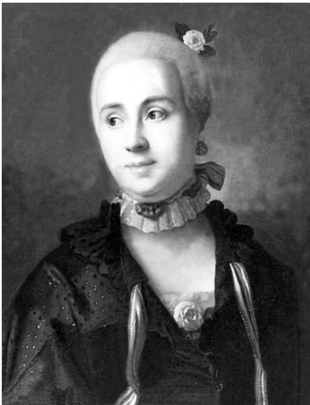
Неизвестный художник. Портрет А.К. Воронцовой

В то время как С.Р. Воронцов познавал жизнь российскую, его брат Александр Романович знакомился с особенностями европейского быта. Отец при отъезде его во Францию в 1758 году напутствовал: «Помни, мой друг, что ты поехал учиться, а не щеголять <...>, мотовством доброго имени не наживешь <...>». В школе chevaux legers он пробыл полтора года и писал: «Шлюсь на всех беспристрастных людей, кои меня знали в сем городе (Париже), что знание девок, балов и прочих публичных мест, что столь других веселило, мне ни малое удовольствие не делало <...>, мало находится людей в мои лета, кто б столь мало в дебошах наслаждался, как я», – писал А.Р. Воронцов [3]. Отец напрасно волновался за сына, он был серьезным не по годам. В 1759 году А.Р. Воронцов для дяди-канцлера составил описание португальского и испанского дворов. В 20 лет началась его дипломатическая карьера. В 1761 году он стал поверенным по делам Российской империи при Венском дворе.