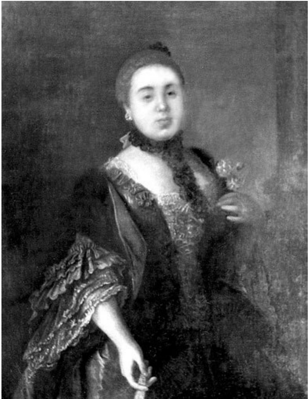
Неизвестный художник. Портрет Е.Р. Воронцовой (в замужестве Полянской)

трица потребовала, чтобы она не присутствовала на коронационных торжествах в Москве. В 1765 году Елизавета Воронцова выйдет замуж за А.И. Полянского (1721–1818), и Екатерина II, продемонстрировав милость и умение прощать, стала приемной матерью ее сына, назначила во фрейлины ее дочь Анну [10].