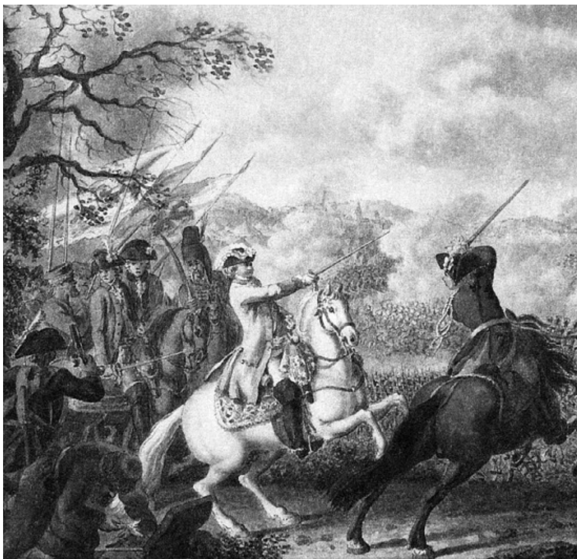
Д. Ходовецкий. П.А. Румянцев в сражении при Кагуле 21 июля 1770 г.

За несколько дней до этого П.А. Румянцев отправил Воронцова с 200 егерями сбить с позиции от 2 до 3 тысяч турок, засевших в кустарнике вдоль фронта всей армии. Приказ был выполнен. Потери противника после сражения насчитывали более тысячи человек убитыми и до 2 тысяч ранеными, разбитой оказалась вся артиллерия. Потери русских – 90 человек. За битву при Ларге С.Р. Воронцов был удостоен ордена Святого Георгия 4-й степени.