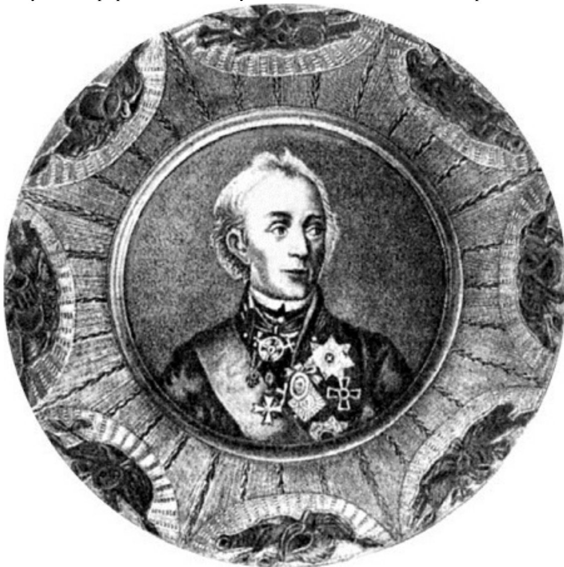
Неизвестный художник. Изображение А.В. Суворова на табакерке

Военно-тактические приемы Воронцова принесли ему уважение А.В. Суворова. «Тактика ваша, – писал тот Воронцову, – должна быть в кабинетах всех государей» 35 . Подобно А.В. Суворову Воронцов искренне беспокоился об условиях жизни своих подчиненных и делал все возможное для улучшения солдатского быта. «Мы молим за него Бога, – говорил один из старых сослуживцев графа Ф.В. Ростопчину. – Он был нам отец, а не командир» [2].